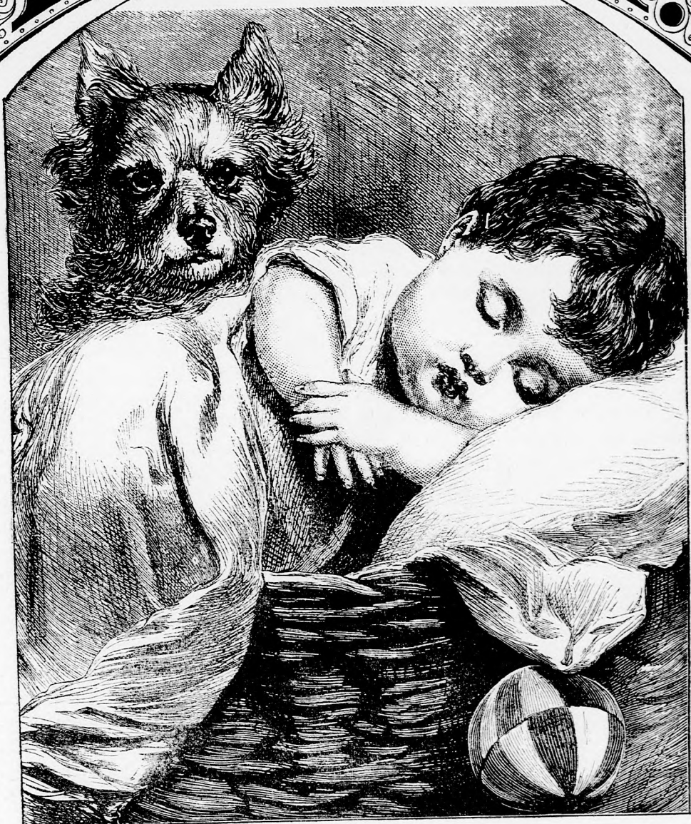
Hű örökös. (Lásd a 76. lapon.)