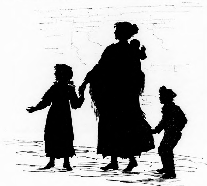
SÖTÉT KÉP. (Lásd a 206. lapon.)

megmenteni, de szélütött maradt. Matild lemondott a bálokról s a világi örömről; a leggyöngédebb leányi szeretettel vette körül nagybátyját; előszedte tanulmányait is, hogy megédesítse a nagybátyja és saját életét. Akkor értette meg, hogy csak az cselekszik helyesen, ki tudatával bir társadalmi állásának s nem igyekszik erején tul terjeszkedni, hanem megma-