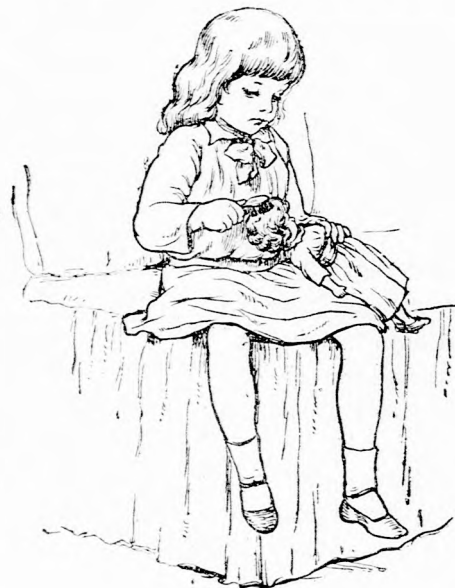
A GONDATLAN BÁBU. (Lásd a 203. lapon.)

lenni édes József-neki, hogy hallgassék, jókor el fog jönni,