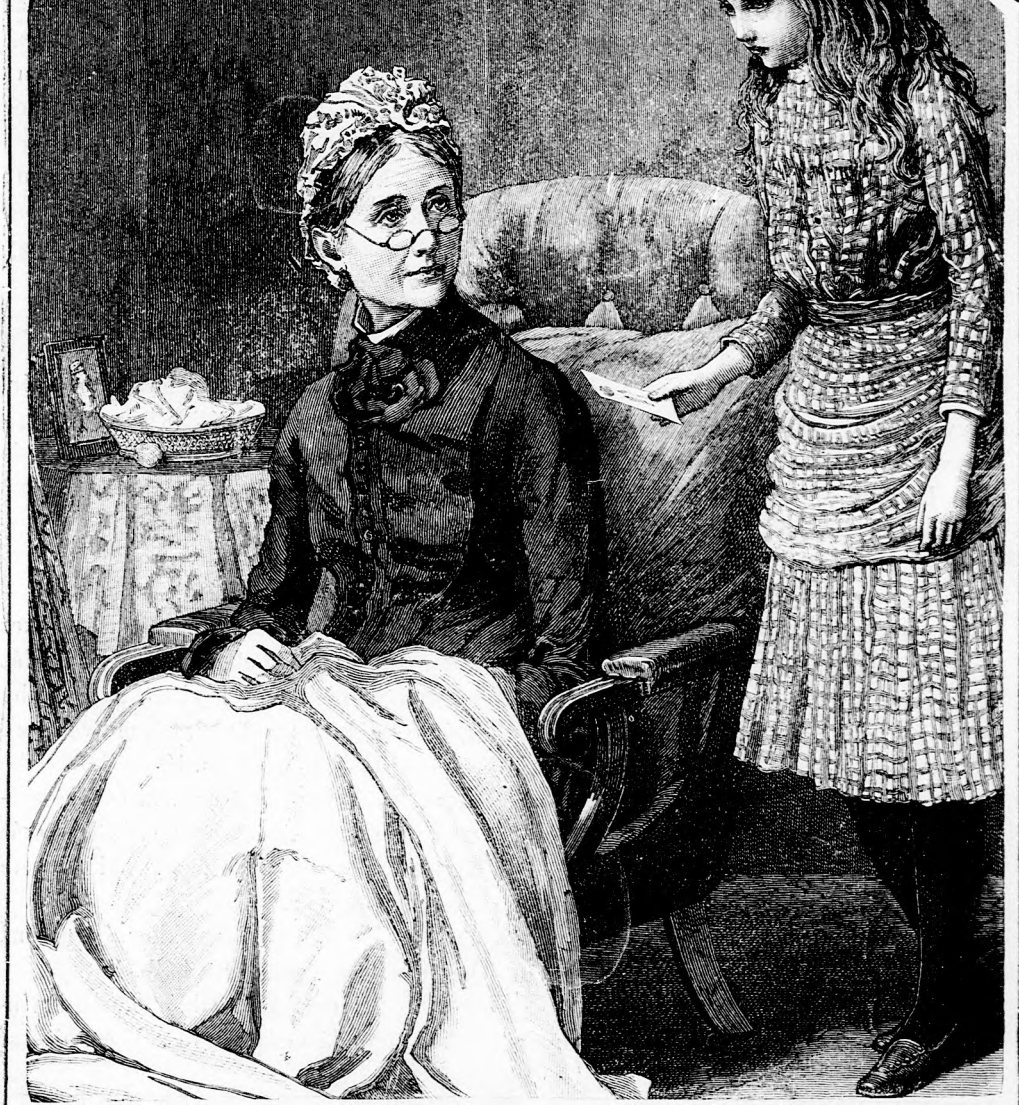
MEGTÉRÉS. (Lásd a 198. lapon.)