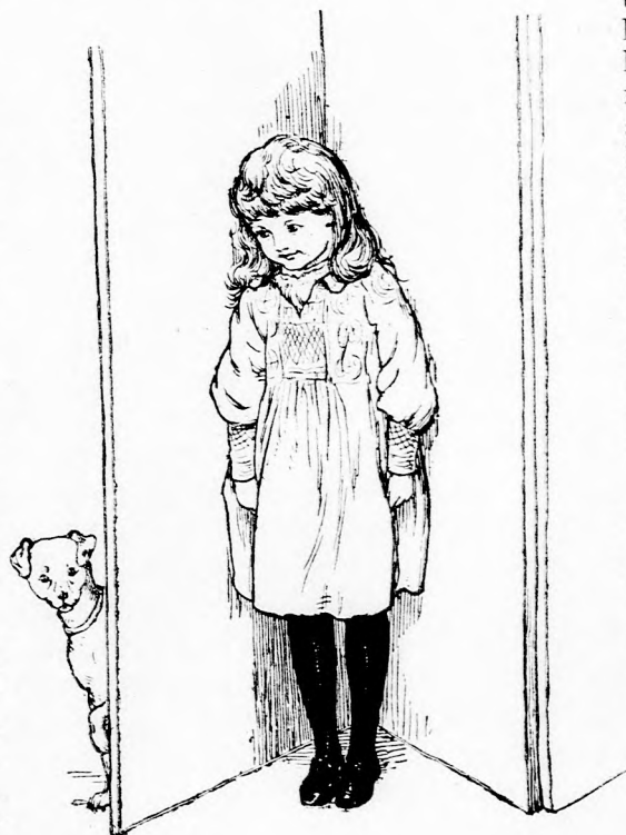
... ELBUJTAM. (Lásd a 220. lapon.)

aztán nem pironkodtam többé, hanem játszottam s megtapsoltak. Mamám pedig mosolygott.