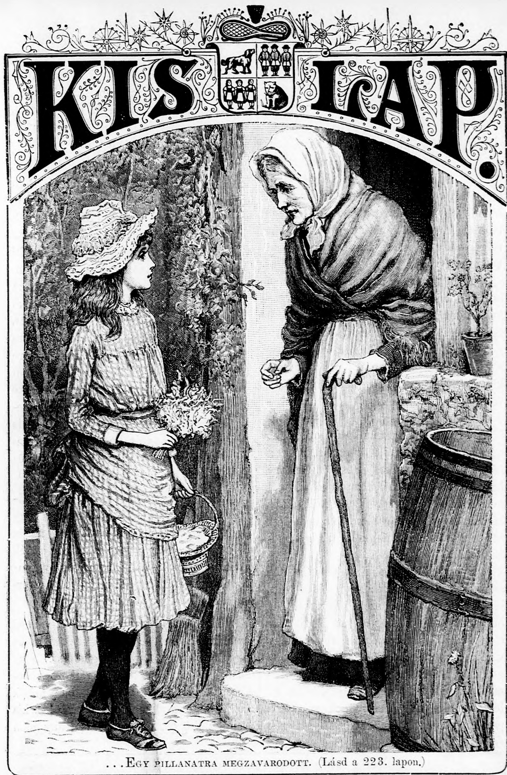
... EGY PILLANATRA MEGZAVARODOTT. (Lásd a 223. lapon.)