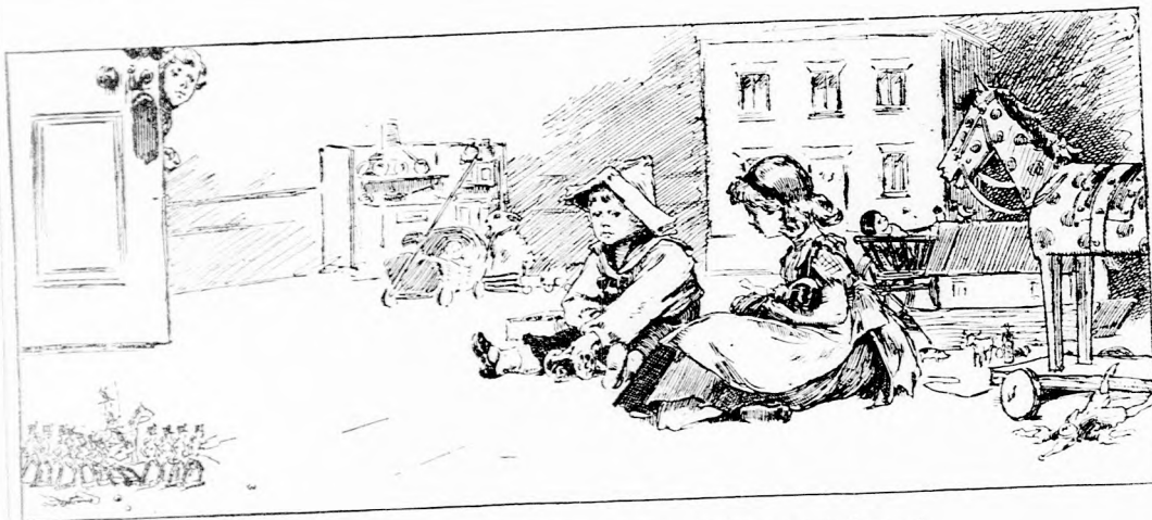
... NAGY JÁTÉKBAN TALÁLTA ÖKET. (Lásd a 213. lapon.)

szonytól, ha valamiről nem tudjátok bizonyosan, vigyétek-e magatokkal vagy sem, szólt a mama.