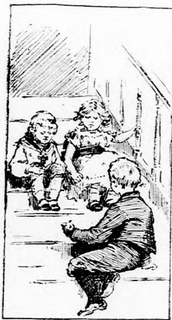
VALLATÓRA FOGTA ÖKET.

Rudi észre is vette, hogy két hü követője kissé nyakaskodik. Vallatóra is fogta őket, de Szidike és Benczike nem akarták megvallani, milyen titok nyomja a szívöket. Rudi pedig aztán nem sokat