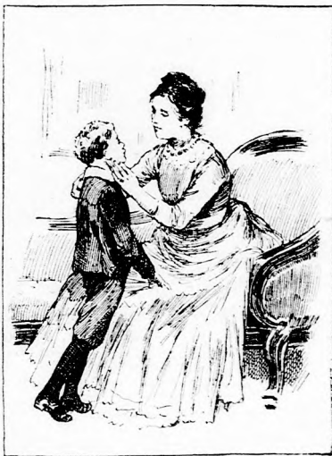
A MAMA KOMOLY BESZÉDET KEZDETT. (Lásd a 214. lapon.)

beüljek a szobába és gyötörjem az eszemet unalmas tanulással! Abból ugyan semmi sem lesz. Én ott az erdőben fogok járni, fára mászni, madarat fogni, csinállok hálót, horgot, aztán eljárrok halászni. Bizonyosan van ott valakinek puskája is, elmegyünk vadászni. Aztán fogok lovagolni, mert falun van ám sok szép tüzes paripa. Majd a legtüzebbet választom ki. Meglásd, milyen jól megtanulok lovagolni.