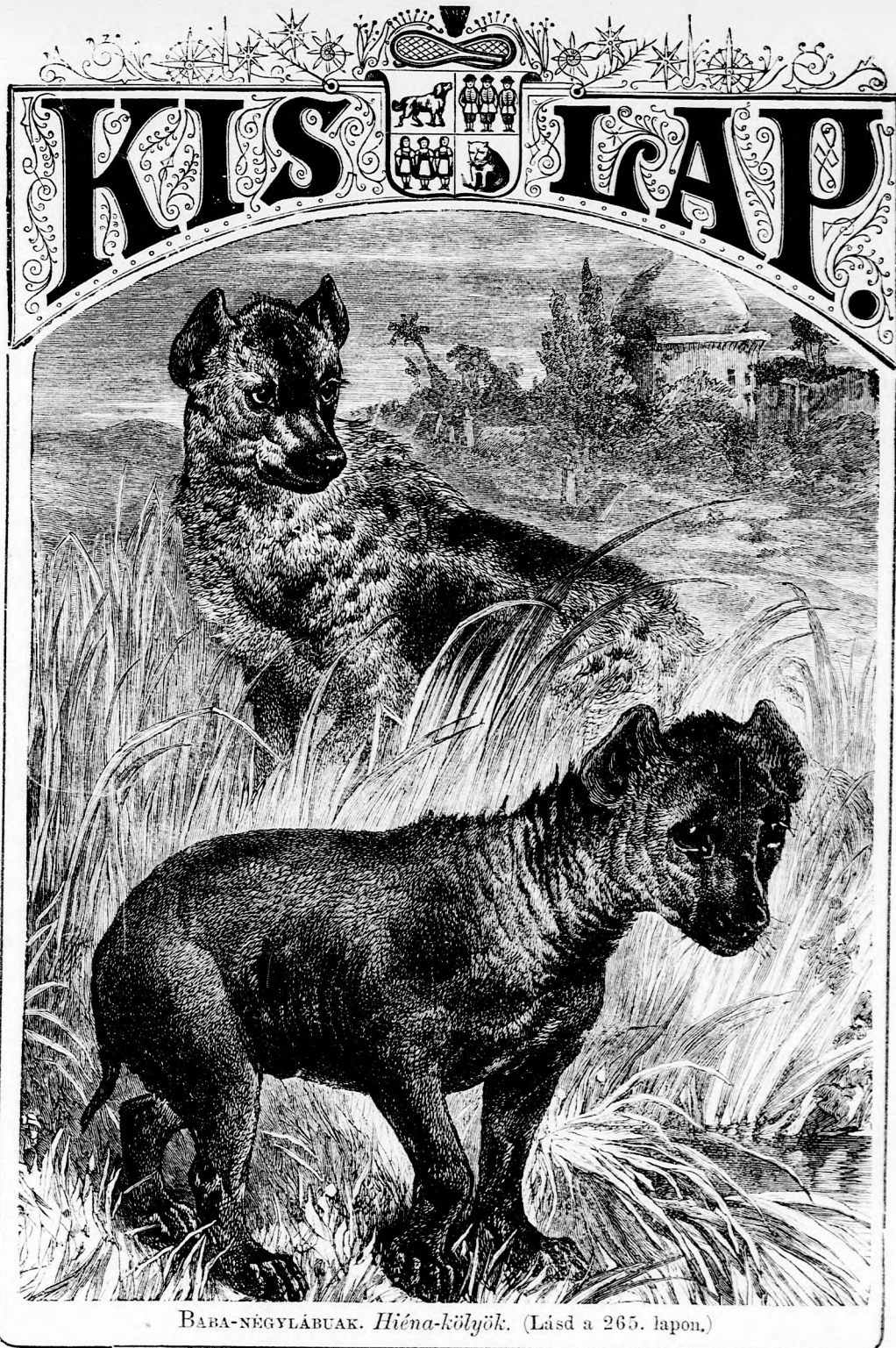
BABA-NÉGYLÁBUAK. Hiéna-kölyök. (Lásd a 265. lapon.)