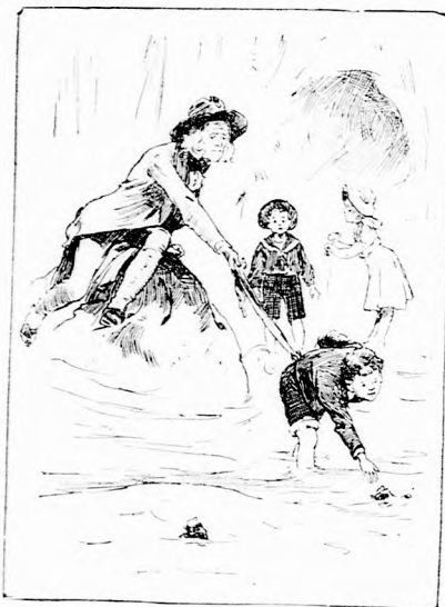
... KIHÁLÁSZTA A CZIPÖKET.