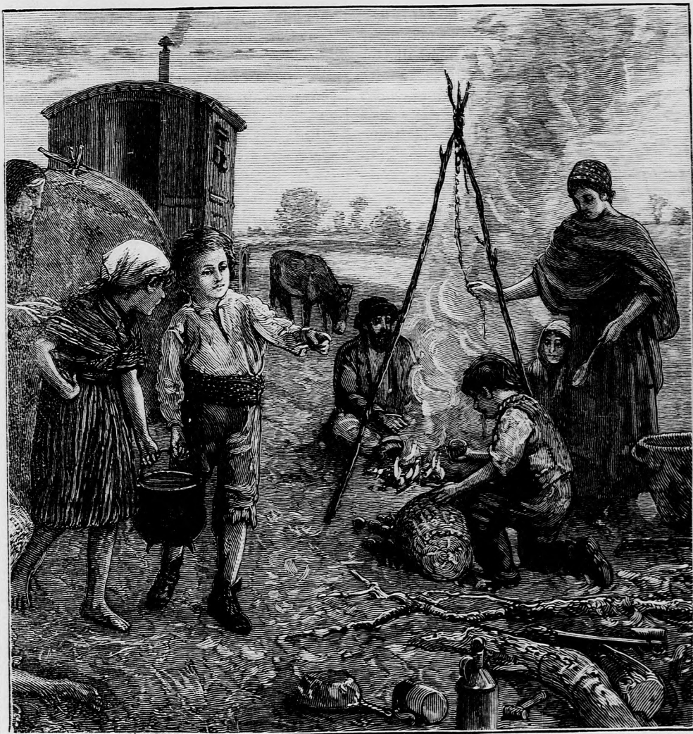
... FELEJÖK MUTATOTT. (Lásd a 382. lapon.)

Ez a mondás nem tetszett Esztikének, de még Janikának sem, ámbár olyan kicsinyek voltak ők még, hogy nem igen tudták, mit akar Béla azzal mondani. De