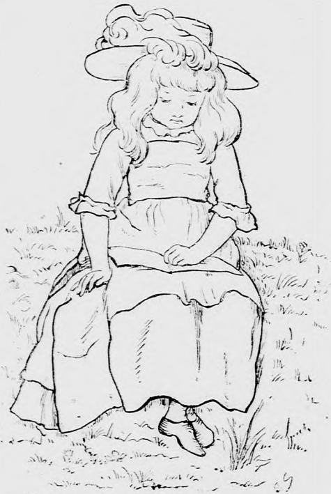
... OTT OLVASGATOTT. (Lásd a 402. lapon.)

— Máskor is teszek effélet. Fölösleges időmet, csemegéimet, játékszereimet megosztom azokkal, a kik kevésbé szerencsések, mert legtöbbet ér jót tenni, bárha csak kicsiben is.