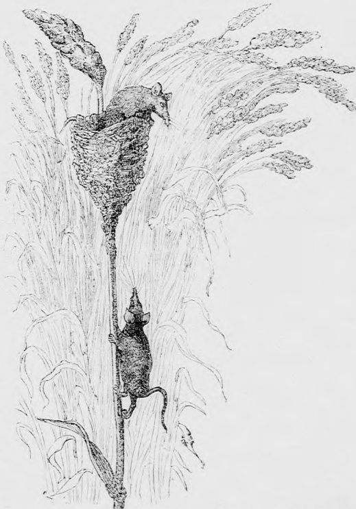
... HÍVTA A TESTVÉRÉT. (Lásd a 13. lapon.)