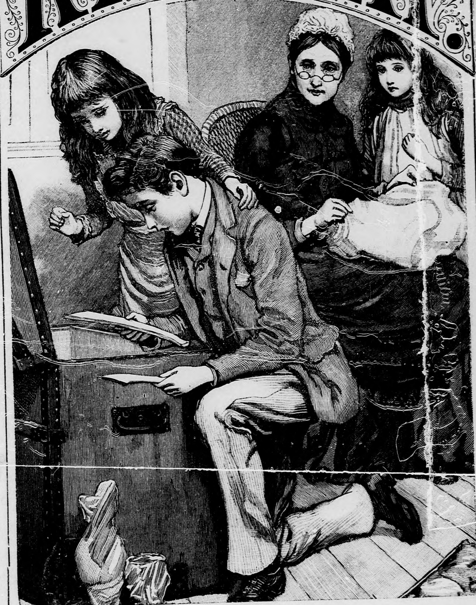
BESZÁMOLÁS. (Lásd a 15. lapon.)