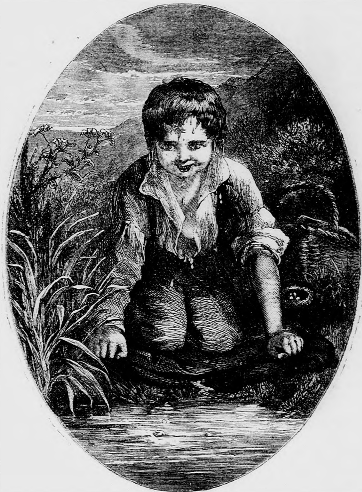
HÜTÖZÉS. (Lásd a 86. lapon.)

nem leszünk készen a munkánkkal! Mit gondol majd édes apa? Azt fogja hinni, nem gondoltunk reá.