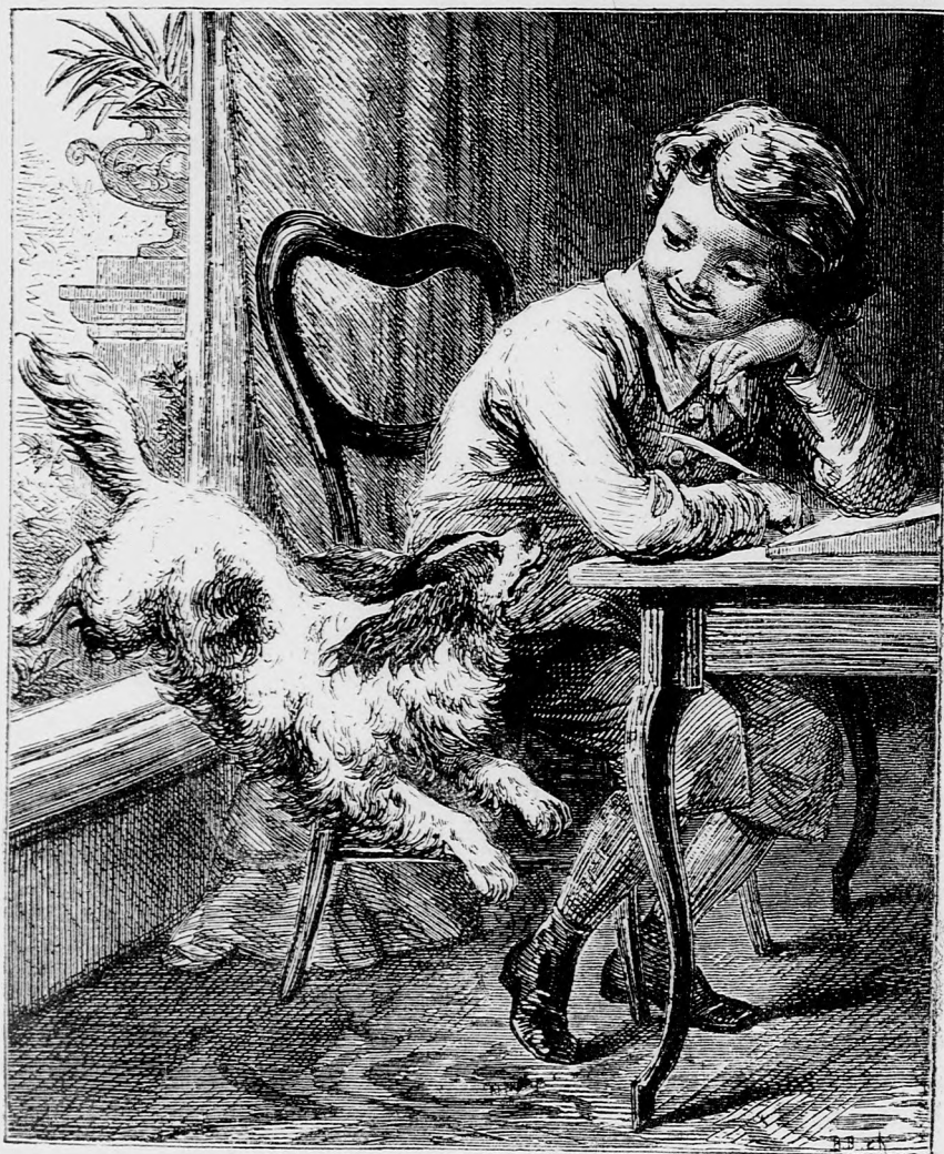
LÁTOGATÁS. (Lásd a 85. lapon.)

gondolod, hogy a tanító ur engem is csak úgy a többiekkel együtt hív meg a mulatságra. Hát nem mondtam már elégszer,