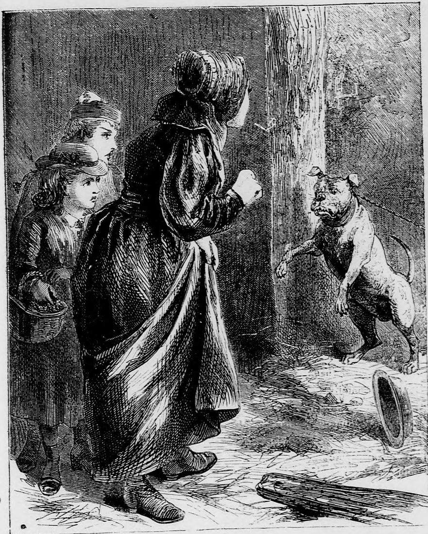
... DÜHÖSEN UGATOTT. (Lásd a 121. lapon.)