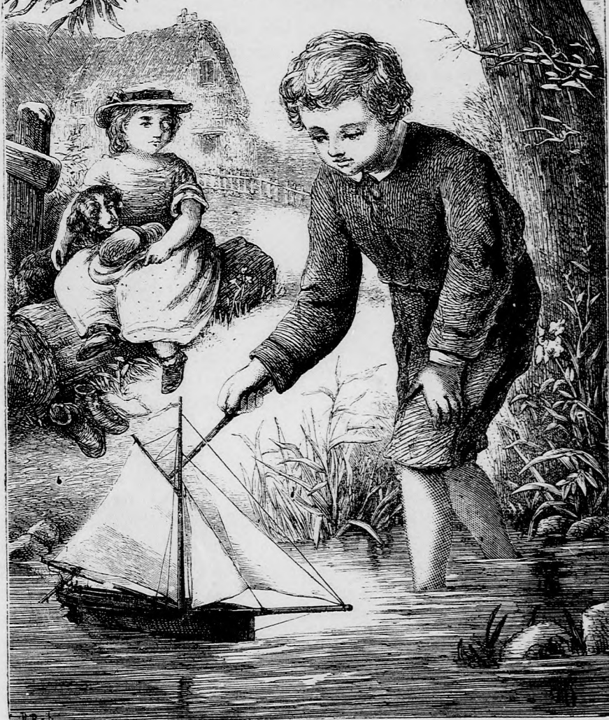
SIKERÜLT PRÓBA. (Lásd a 119. lapon.)