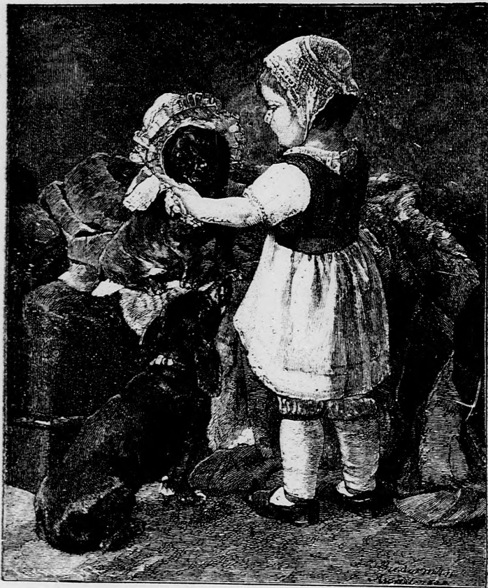
... ENGEDTE MAGÁT FELÖLTÖZTETNI. (Lásd a 122. lapon.)

csalogatásra, nem akart lejönni a fáról. De minden figyelmünk a szökevényre levén irányozva, egészen megfeledkeztünk arról, hogy a kalitka nyitva van s a másik kanári is kiszökhetik Ki is szökött s egyszerre