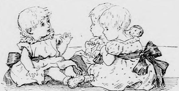
NAGY TANÁCSKOZÁS. (Lásd a 160. lapon.)

Álmos is ébredezni kezdett mély álma után; aztán körülnézett, de bátyját nem látva maga mellett — nagyot sóhajtott, hogy bár láthatná őt bátyja és gyönyörködhetnék az ő boldogságában, vagy legalább ő láthatná végre bátyját, kit olyan régen hagyott künn abban a csunya, rideg világban a beteg fiuval, kinek életéért a fenevadak ellen küzdött.