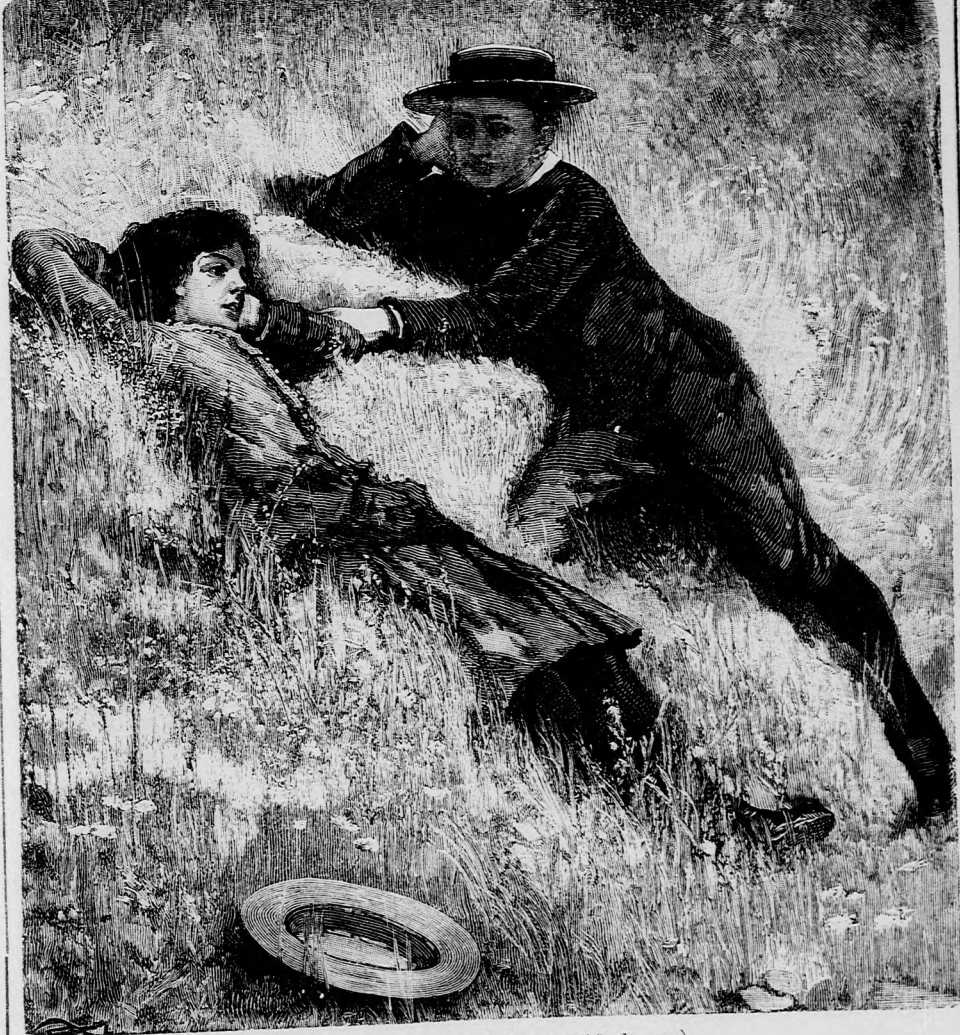
BUCSU-HEVERÉS. (Lásd a 159. lapon.)