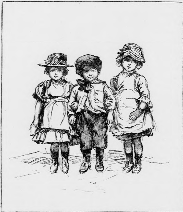
A FOTOGRAFUSNÁL. (Lásd a 330. lapon.)

-- Itt van egy nagy hajó, ni. Oda megyünk kérdezősködni.