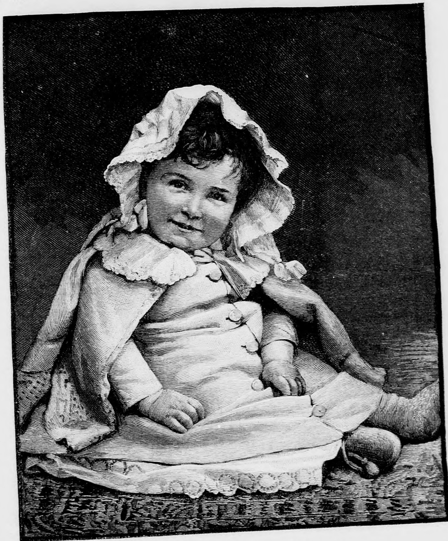
A FOTOGRAFUSNÁL. (Lásd a 330. lapon.)

hetek vissza, vége mindennek. Felülök a hajóra és megyek akár a világ végeig.