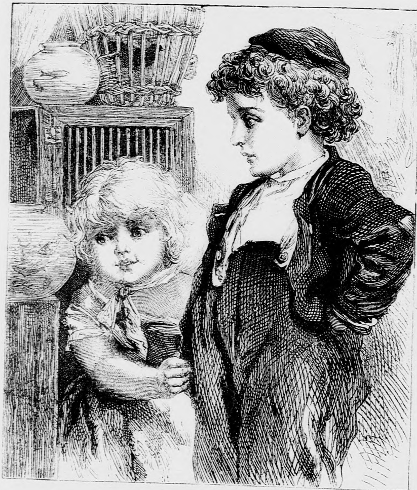
KARÁCSONI REMÉNYEK. (Lásd a 389. lapon.)