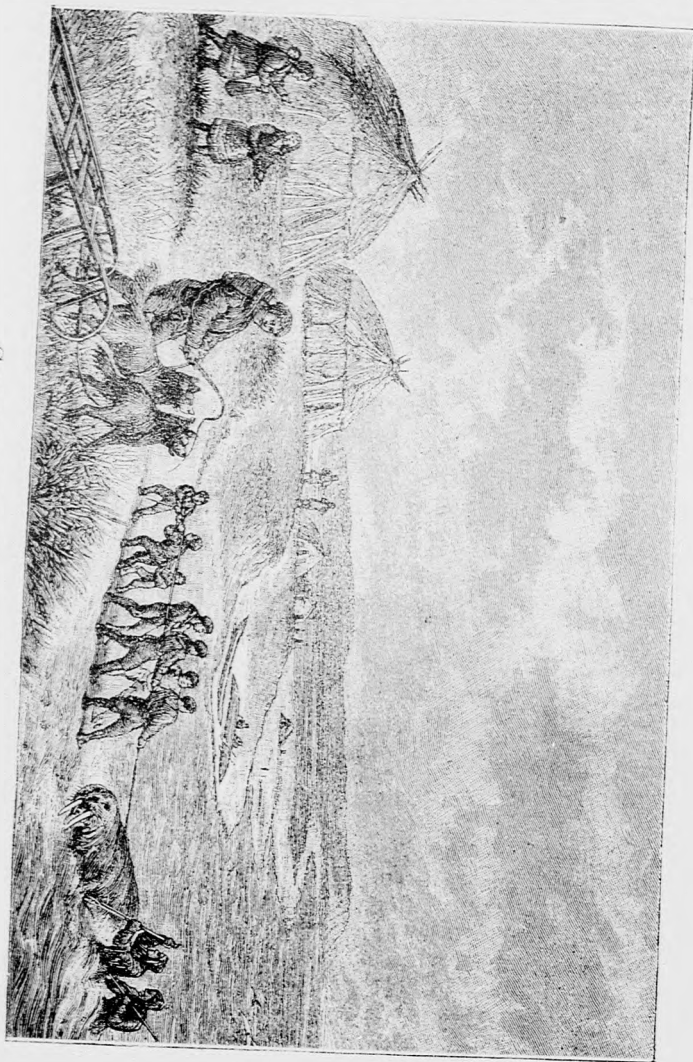
OSIKOS TANYA A TENGERPARTON.

nyáznak és dolgoznak. Ennek összevarrott rozsmár- és fókabőr takarója sokszor egészen lyukas és kopott; meglátszik rajta, hogy már egész nemzedékek hasz-