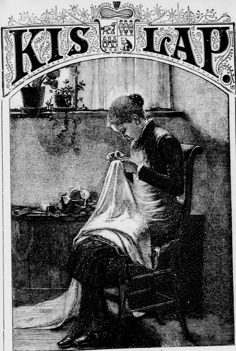
MAMANAK. (Lásd a 390. lapon.)

Ára negyedévre 1 frt 40 kr. Megjelen hetenkint egyszer. 16 oldalon.