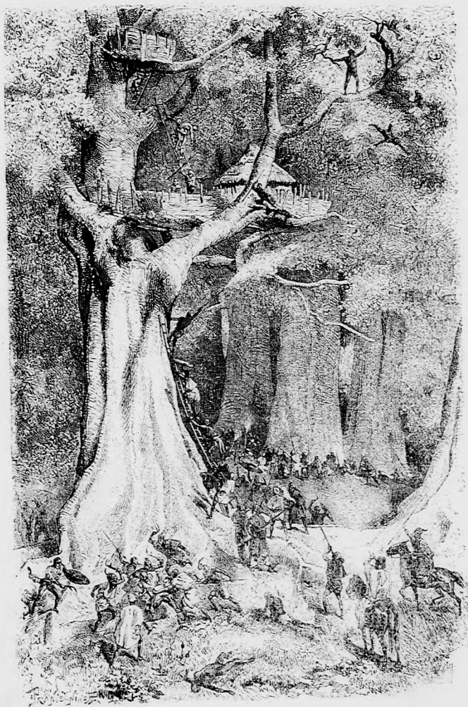
A FAVÁR OSTROMA.

fölegyenesedett, üldözőit haragosan megfenyegette az öklével, csúfolta őket, és megvetését fejezte ki; bátorító kiabálás-