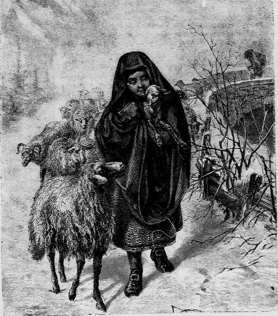
FÁZÓ BARIKA. (Lásd a 87. lapon.)