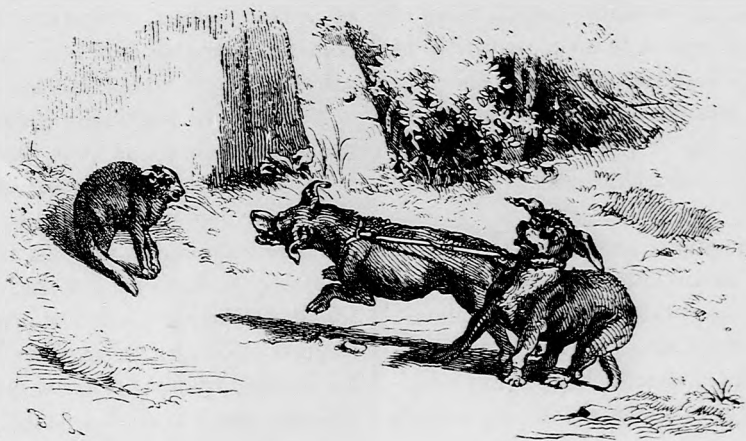
... FARKAS-SZEMET NÉZETT VELŐK. (Lásd a 94. lapon.)