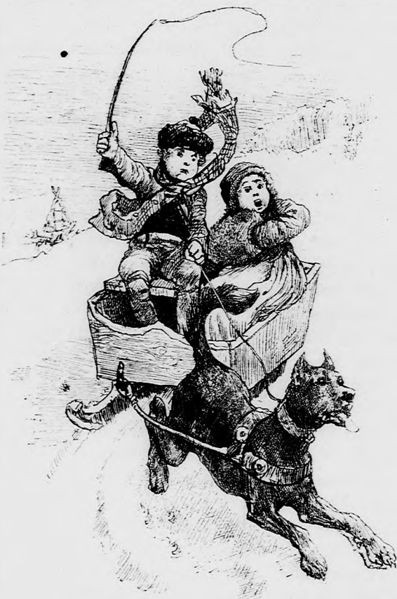
SZÁNKÁZÁS. (Lásd a 94. lapon.)

A fiuk is roppantul örültek, hogy megint itt van köztük az ő kedves Piri-kéjük. Különösen Jani, a ki Piroskát a