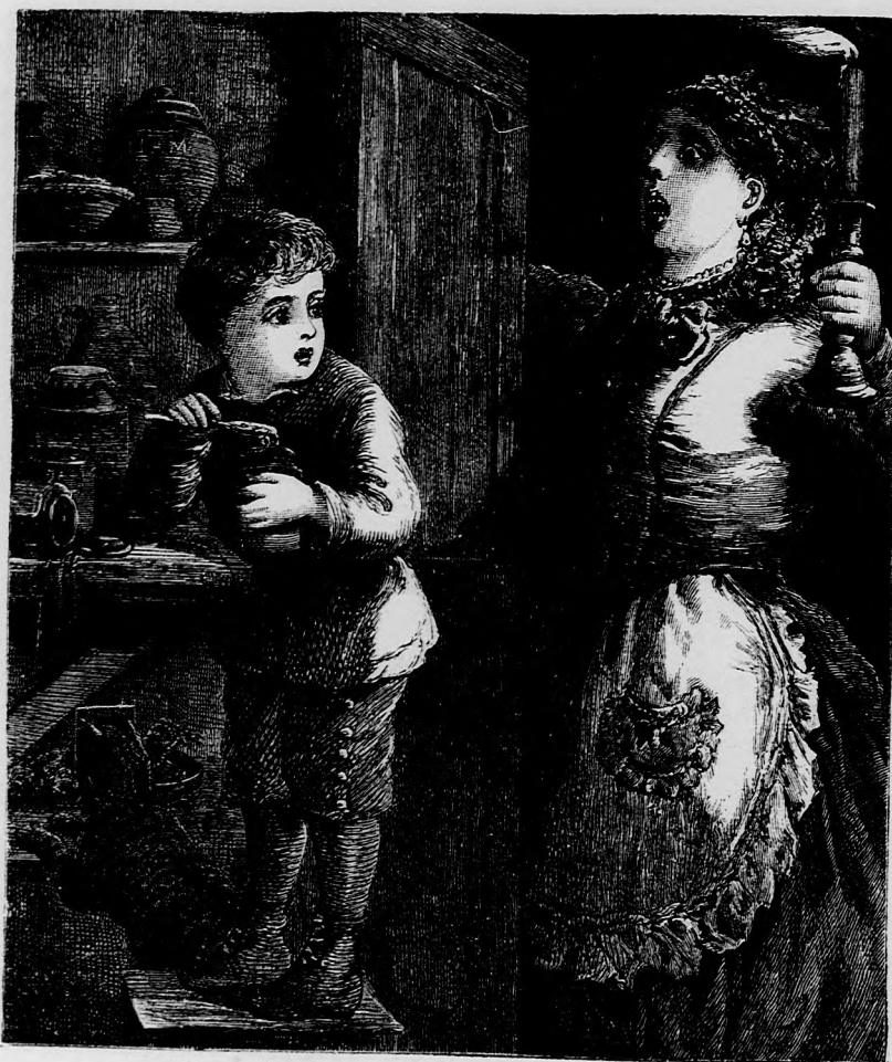
TILALMASBAN. (Lásd a 108. lapon.)

— Igen ám. De hátha valami baj érne téged is a nagy csatában?