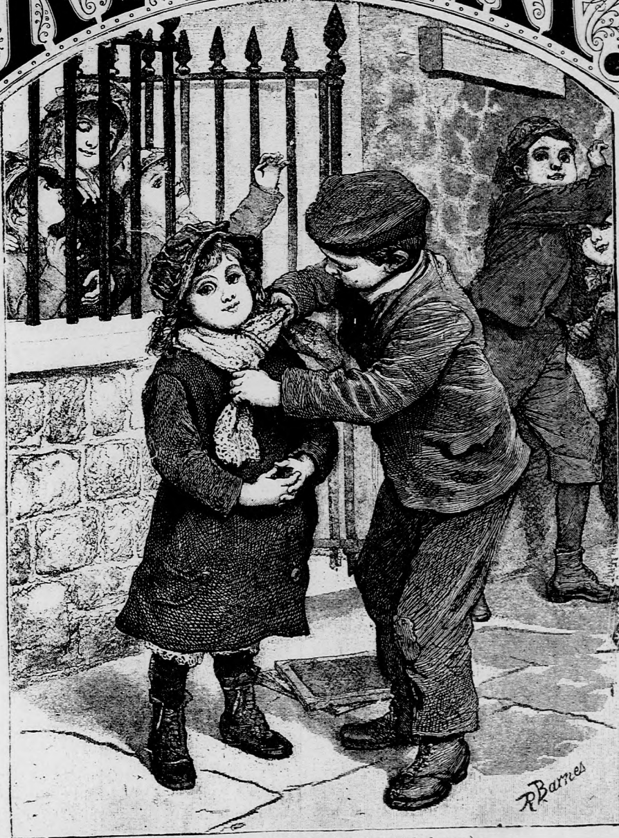
A LEGJOBB MELEGITŐ. (Lásd a 110. lapon.)