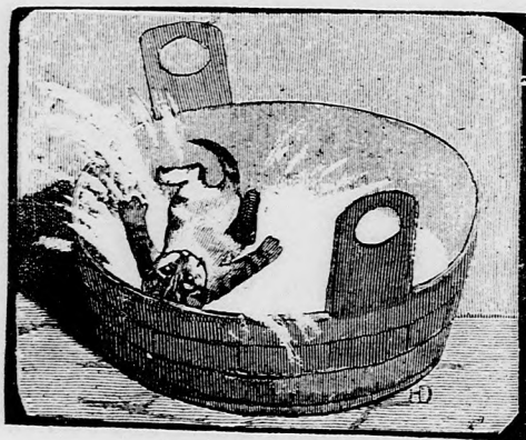
... BELE A JÓ TEJECSKÉBE.

az egy heti apró költségekre. Nagyon szűkön volt kiszabva s a dada pontosan megmagyarázta, mire mennyit szabad költeni, hogy a pénz kitartson vasárnapig. Mert addig nem szabad apától pénzt kérni se husra, se sóra. Piroska gazdálkodott is pontosan, tehát még volt pénze. Aztán volt neki magának is egy pár megtakarított tizeskéje, huszaskája. Ha mind össze szedi, kikerül egy pár forintocska, ha nem is sok. De hát mért kérdi ezt Marcsi? Csodálkozva nézett rá. Marcsi jól látta.