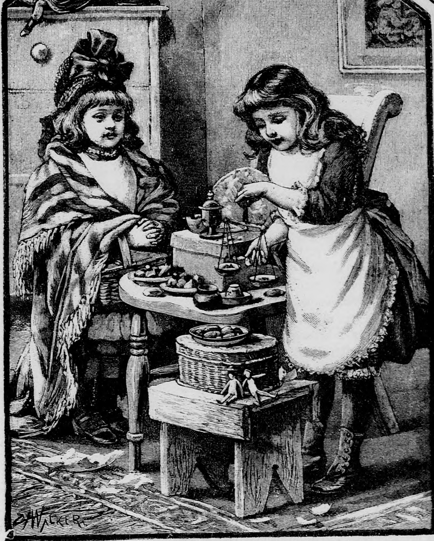
NAGY VÁSÁR. (Lásd a 149. lapon.)