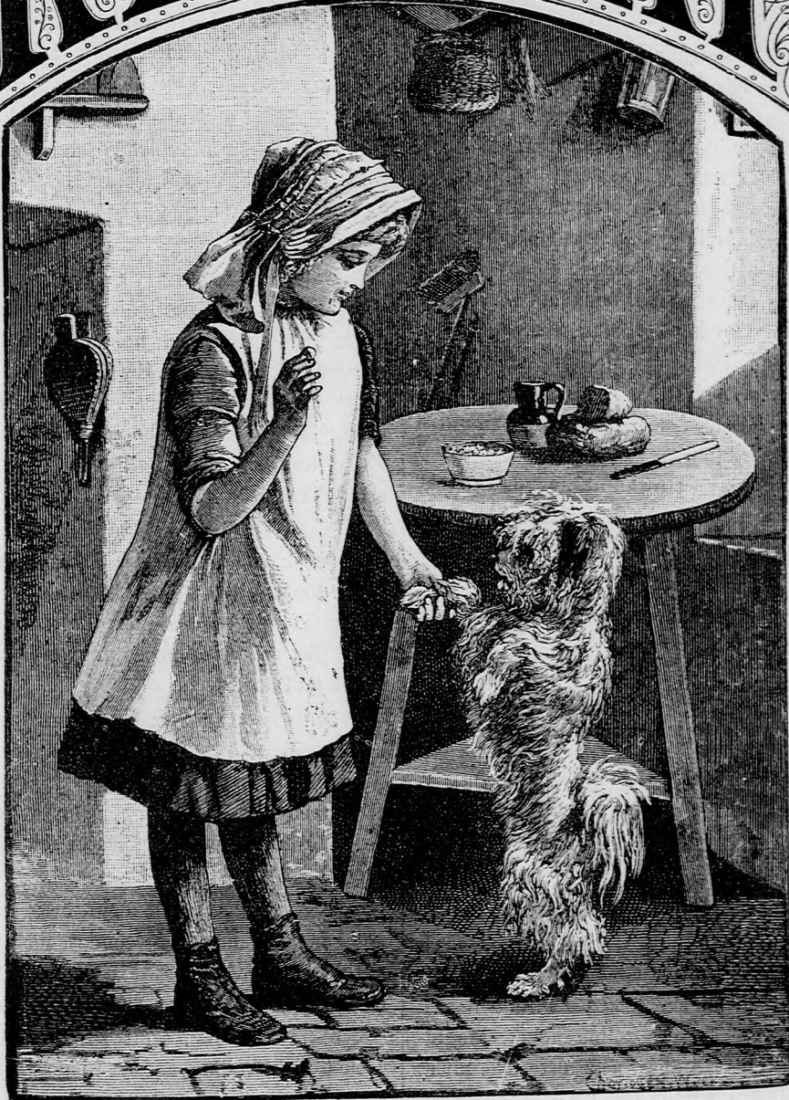
A JELES PUCZI. (Lásd a 187. lapon.)