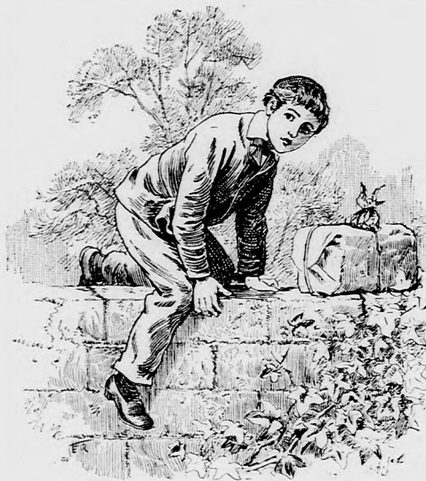
... VISSZA LOPÓZOTT. (Lásd a 389. lapon.)

Össze raktuk. Biz az nem volt valami nagyon sok. Összesen sem sokkal több gyült össze husz krajcárnál, mert a pénzünket az igazgató tartotta ma-