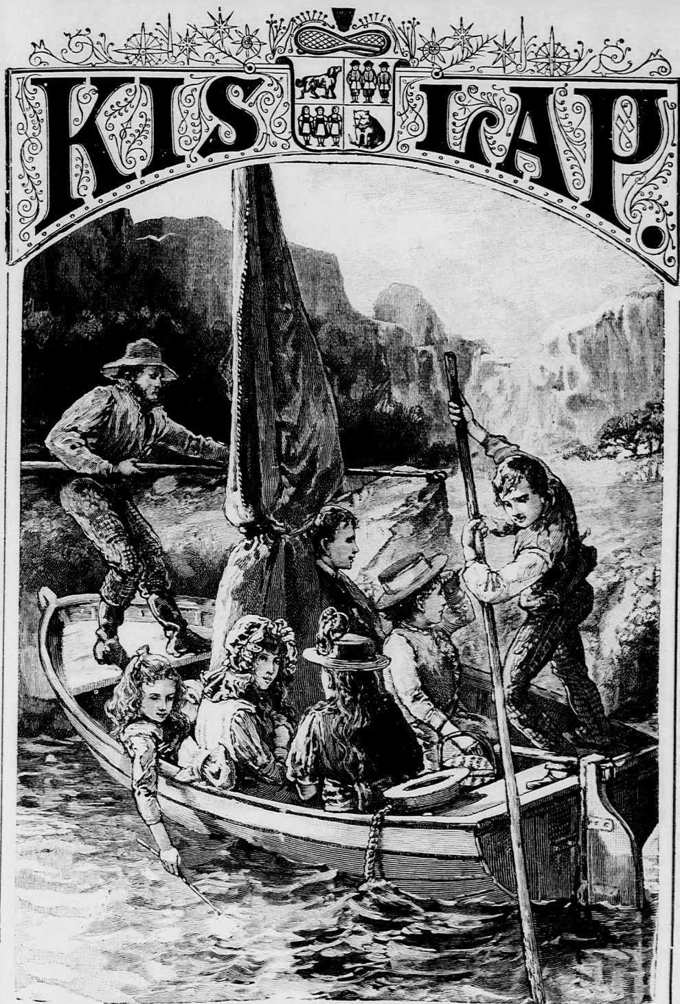
HAZA FELÉ. (Lásd a 390. lapon.)