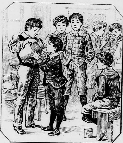
... ÍTTUNK. (Lásd a 390. lapon.)

Az egyik ablaknál a kis Vili volt a strázsa. Mialatt mi többiek nagy kényelmesen úgy félig-meddig felöltözködtünk és készültünk az ostrom vissza verésére, Vili nagyon figyelni látszott valamire. A szomszéd szoba volt a nagy ebédlő s onnan a nyitott ablakon át valami zaj hallatszott ki. Ezt a zajt pedig nagyon