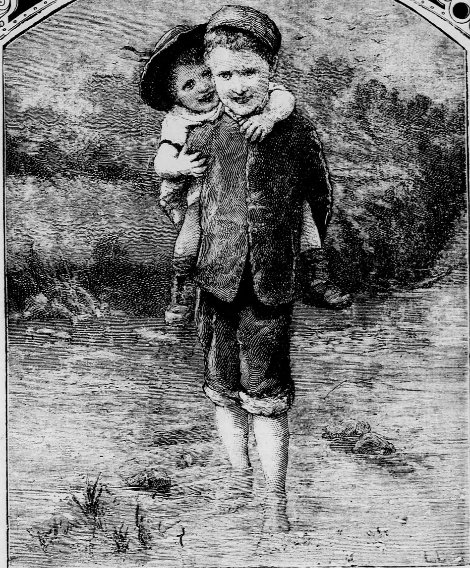
TESTVÉRI SZOLGÁLAT. (Lásd a 38. lapon.)