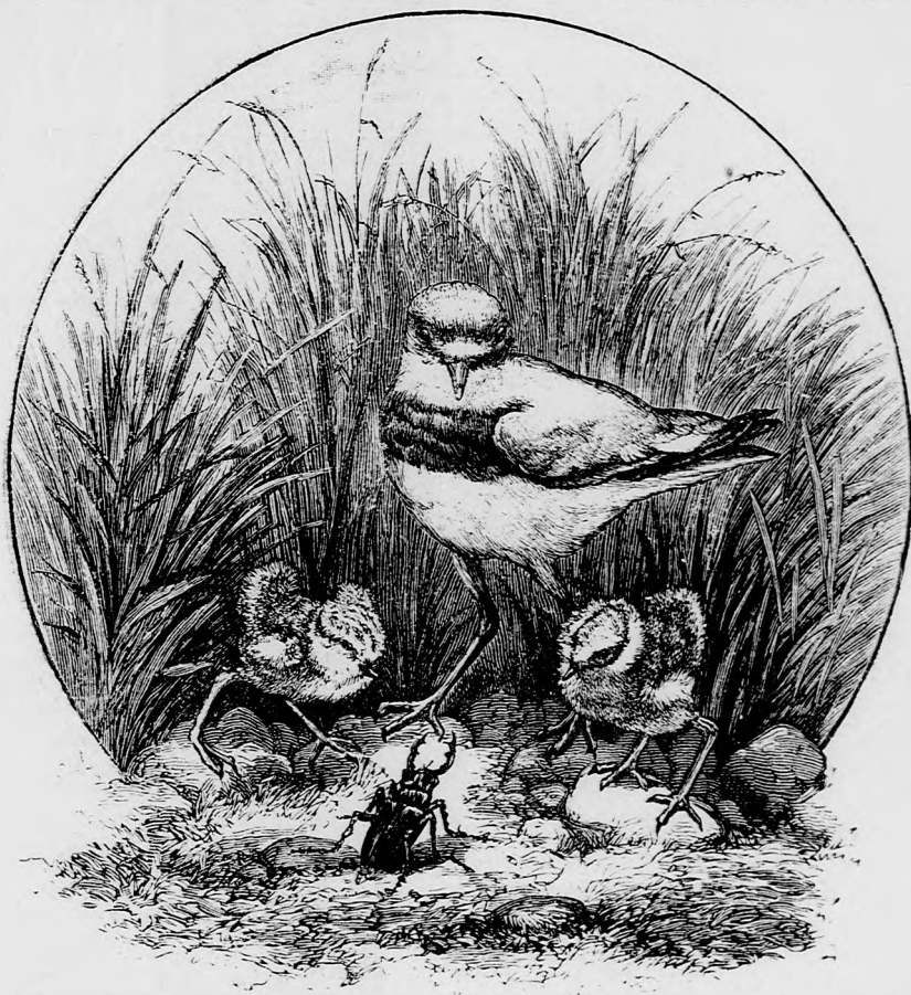
... NÉZEGETTÉK, MIKÉP SÉTÁLGAT. (Lásd a 38. lapon.)

oktatást és eszökbe sem jutott, hogy kimenjenek biztos rejtekökből. Mert hát, mi tagadás benne, valami roppant bátorsággal épen nem dicsekedhettek. Csak ugy titkon irigyelték azokat a hatalmas mada-