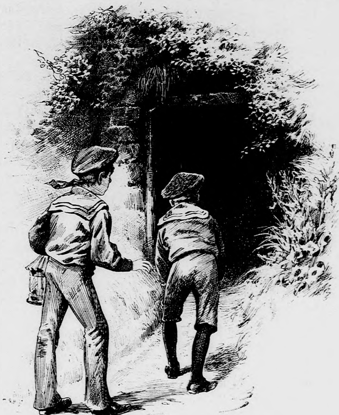
MEGINDULTUNK A BÁNYÁBA. (Lásd a 46. lapon.)

— Itt nem messze kijutunk az utra, sugtam öcsémnek. Ha csak közönséges