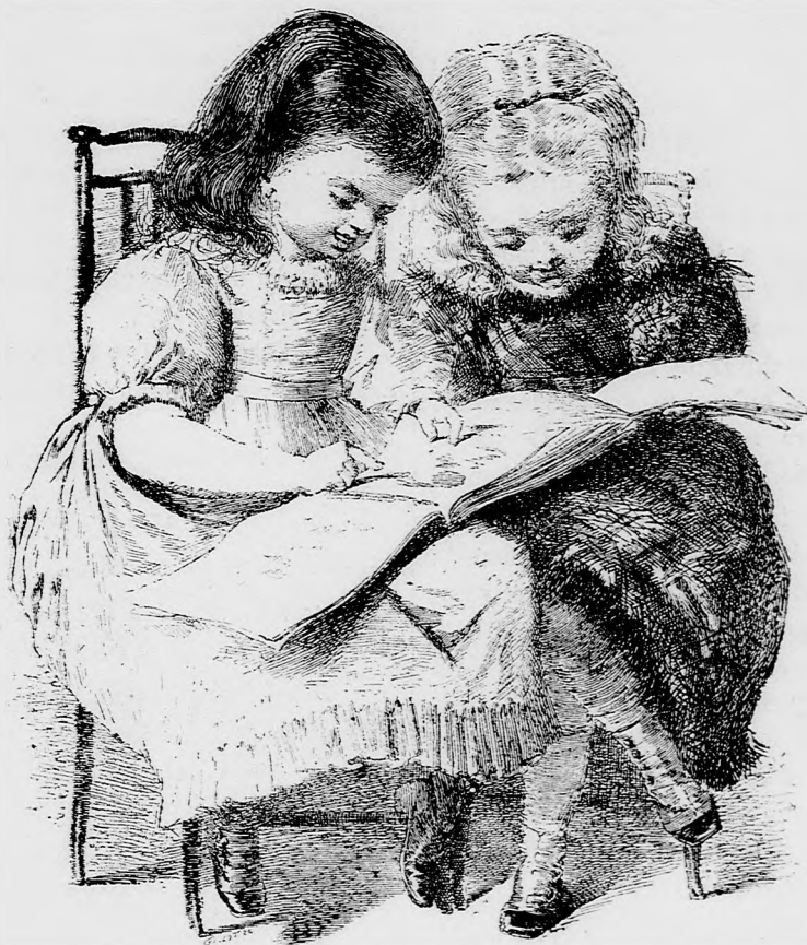
... MUTOGATVA EGYMÁSNAK. (Lásd a 112. lapon.)

kissé el gyanyja nagyon ja után közt állok, mondá Ottika. Mert én meg nem sokára tizenhárom éves leszek. És ugy-e, fogom még ma látni Tildát is?