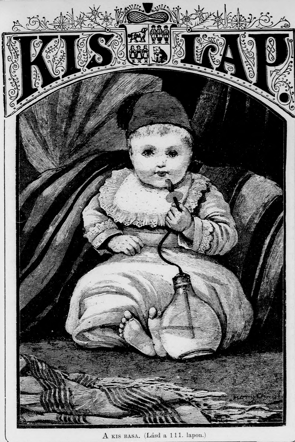
A KIS BÁSA. (Lásd a 111. lapon.)