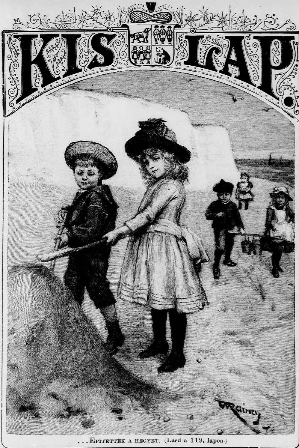
... ÉPÍTETTÉK A HEGYET. (Lásd a 119. lapon.)