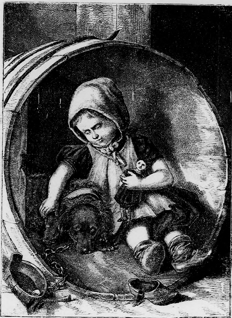
VIGASZTALÓ LÁTOGATÁS. (Lásd a 118. lapon.)

kával, hogy kis öcséink valami kiállhatat- lan ficzkók. Pedig csak kissé pajkosak, mint afféle kis fiuk. Tulajdonképen csak