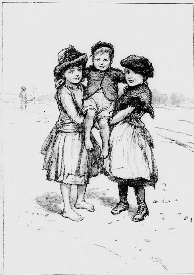
GYALOG HINTÓ. (Lásd a 198. lapon.)

végre is csak pajkos kis fiuk tréfája. És ugy-e jobb lesz, ha most még nem zavarjuk apácskát ezzel a borzasztó históriával.