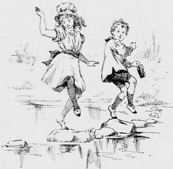
... MEG TUDOM TENNI. (Lásd a 207. lapon.)

megörökítve a falon, szépen hűségesen lepingálva, épenségesen úgy, a hogy történt. És az apa meg a mama, de még az ármányos Fannika is csak nevetnek, mikor oda néznek a falra arra a képre. Akárhányszor gondolt Janika olyanformát, hogy elpusztítja onnét azt a csuf képet. De hát ebben sem volt szerencséje. Olyan magasra akasztották, hogy el nem érte, még ha székre állt is. Egy-