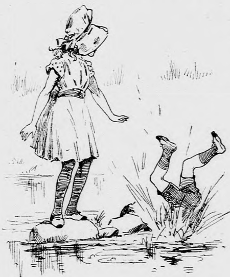
...Zsuprsz! (Lásd a 207. lapon.)