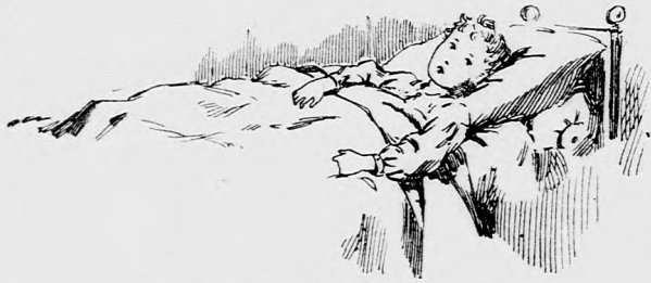
... LEFEKTETTÉK. (Lásd a 207. lapon.)

— Nagyon szép lesz. Alig várom, hogy újra lássalak.