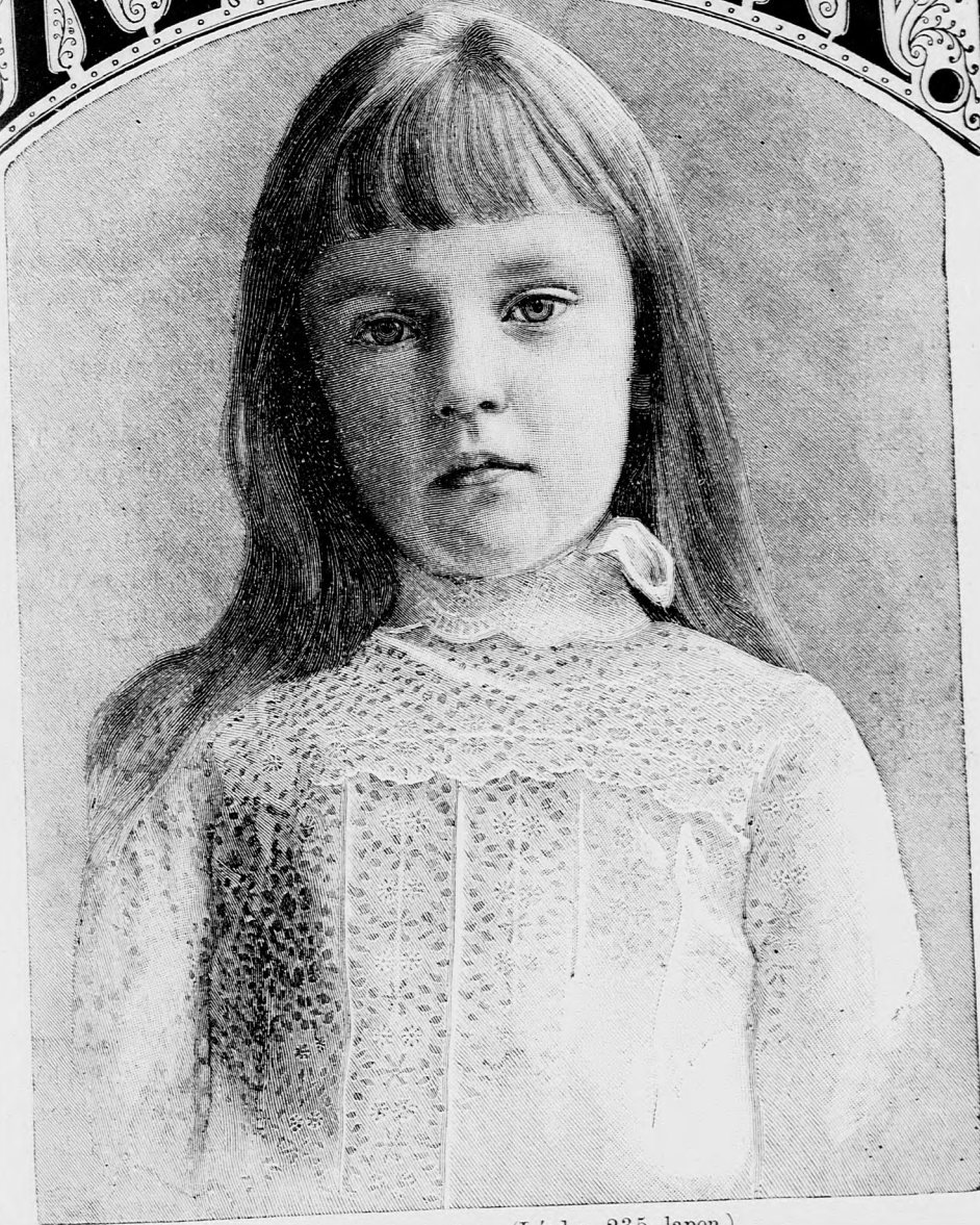
A KIRÁLY UNOKÁJA. (Lásd a 235. lapon.)