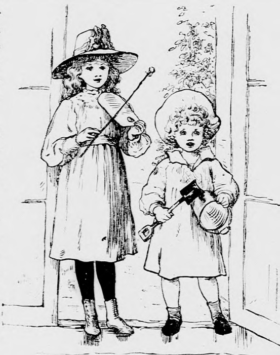
JELÉS ZENÉSZEK. (Lásd a 234. lapon.)

— Ejnye de jól tetted, hogy elhoztad őket. Épe: mondtam Ottikának, hogy már