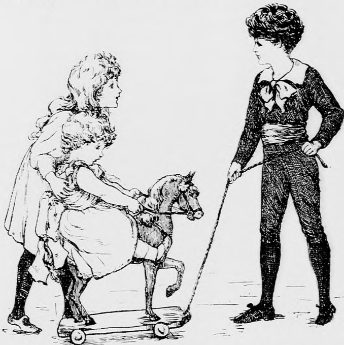
... ELKAPTA A ZSINÓRT. (Lásd a 270. lapon.)

Ezen aztán Flórácska még inkább megharagudott s most már mérgesen kiáltotta Tibornak, hogy távozzék, ez pedig még hangosabban felelte, hogy csak azért