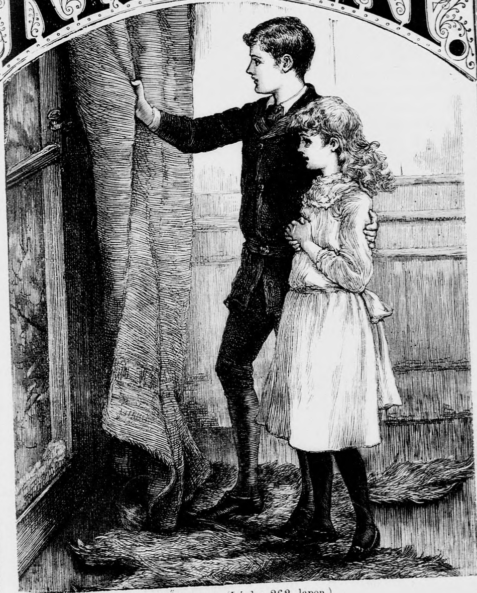
ŐSZI NAP. (Lásd a 262. lapon.)