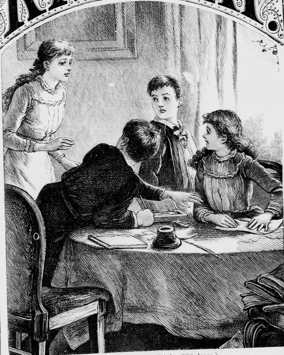
...RÁTETTE A KEZÉT. (Lásd a 280. lapon.)