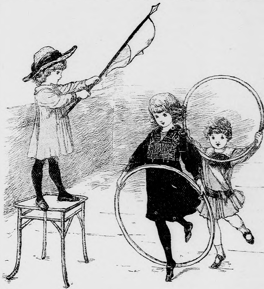
ABRONCS-VERSENY. (Lásd a 6. lapon.)

— No, az már mégis unalmas. Ha Tamás itt volna, bizonyosan találna mindjárt valami játékot... rablókat játszánánk, vagy pedig amerikai vadembereket,