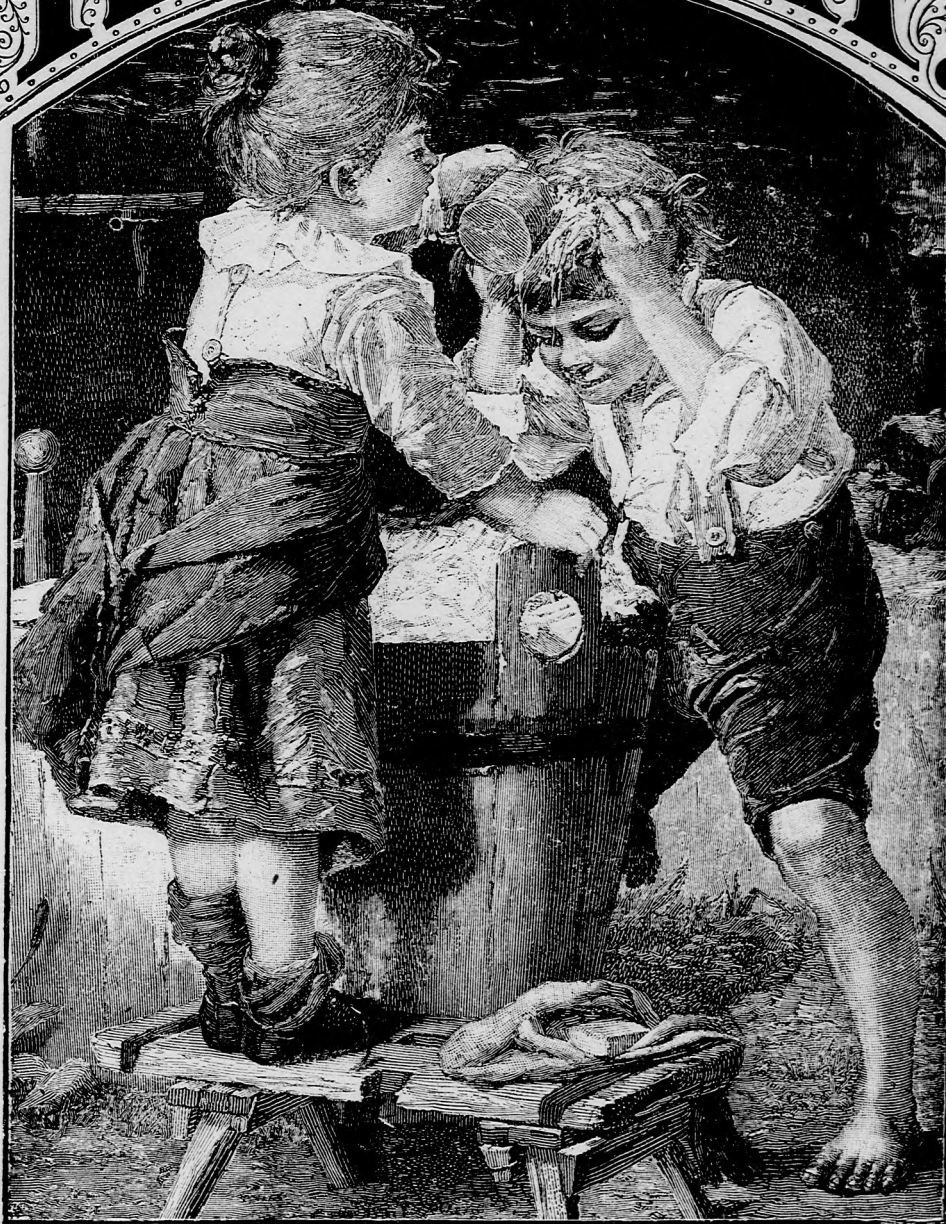
NAGY MOSAKODÁS. (Lásd a 6. lapon.)