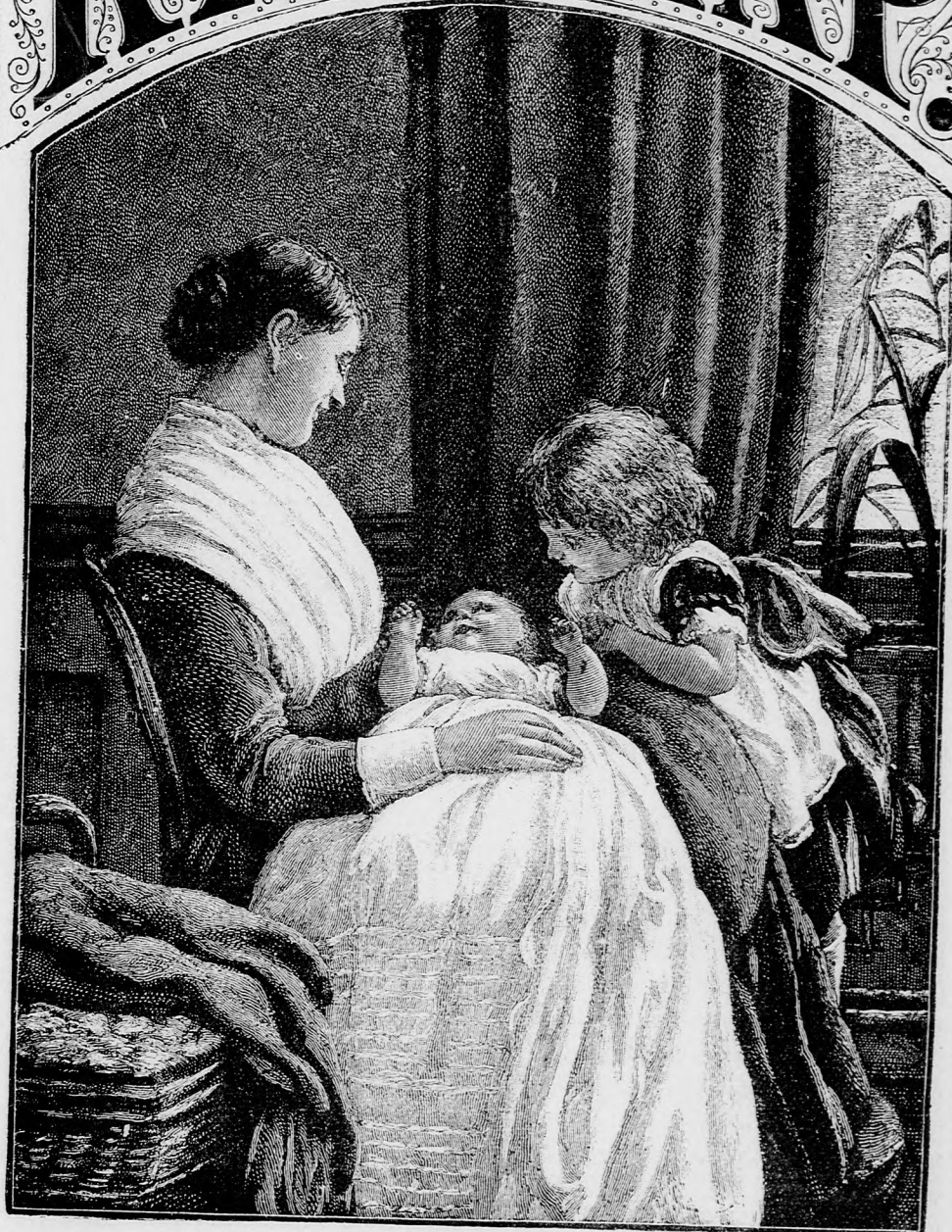
A PICZIKE. (Lásd a 108. lapon.)