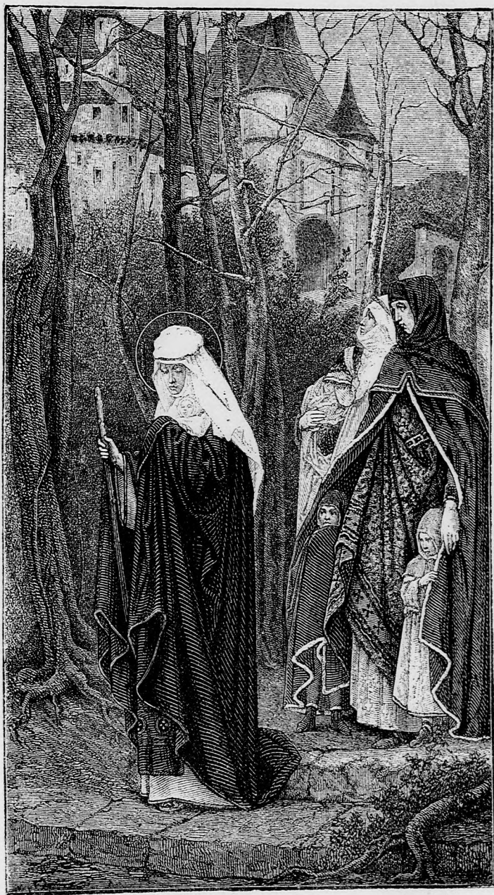
MAGYARORSZÁGI SZENT ERZSÉBET. (Lásd a 105. lapon.)