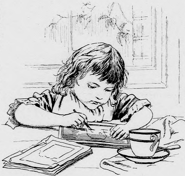
A KIS PIETOR. (Lásd a 182. lapon.)

A nagy terem már csakugyan egészen tele volt. És mind a hányan ott voltak, nagy kíváncsisággal várták, mit fognak hallani. Csak a lelkész, a bíró és még egy pár ember mosolygott, mint a ki