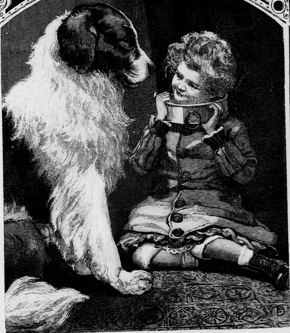
SZEREP-CSERE. (Lásd a 188. lapon.)