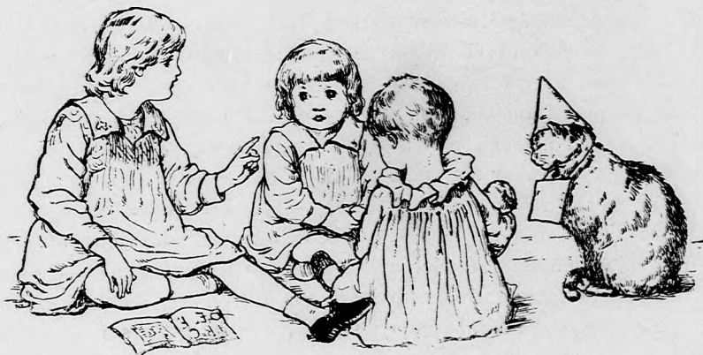
RETTENTŐ ÍTELET. (Lásd a 183. lapon.)

— Ugy van, amint mondom. Hibás, bűnös az egész lakosság. A lelkész ur-