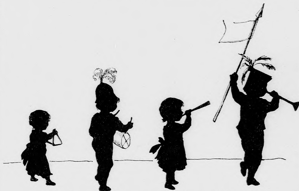
...NAGY JÓ KEDVVEL MEGINDULTAK. (Lásd a 337. lapon.)

— Oh nem! Azaz hogy mégis... mert apácska olyankor igen komolyan megmagyarázta nekem, milyen oktalan-ságot követtem el s mit kellett volna jó- ra való fiúnak tenni. Ezt aztán ugy röstel-