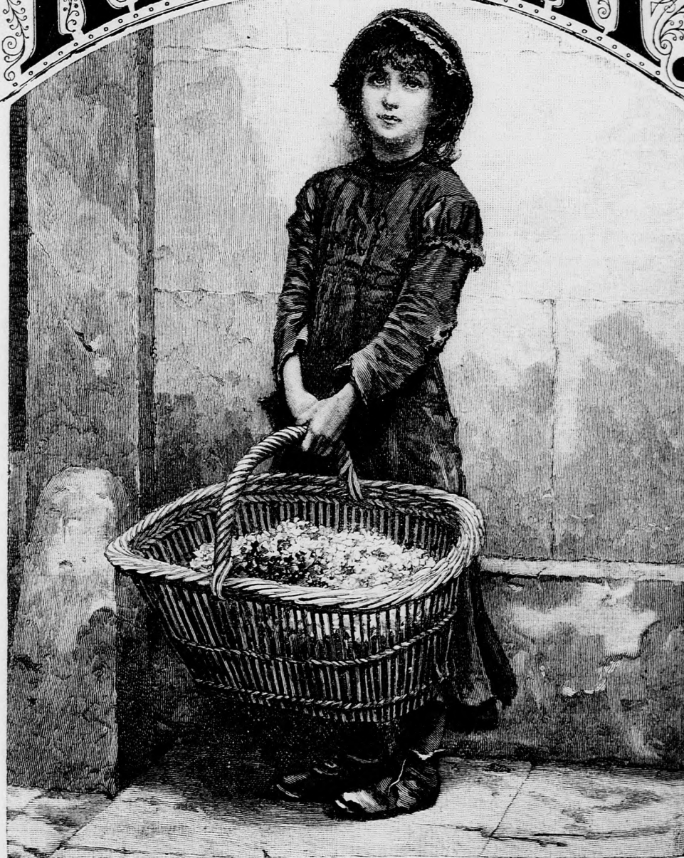
VEGYENEK VIRÁGOT! (Lásd a 350. lapon.)

XXXVIII. kötet, 22. szám. Ára negyedévre 1 frt 40 kr. Megjelen hetenkint egyszer, 16 oldalon.