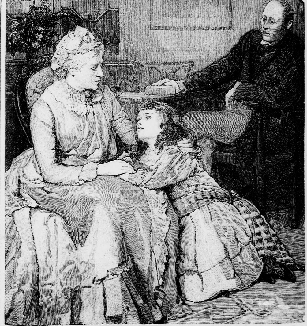
...ODA BORULT... (Lásd a 367. lapon.)

XXXVIII. kötet, 23. szám. Ára negyedévre 1 frt 40 kr. 1890. június 8-án. Megjelen hetenkint egyszer, 16 oldalon.