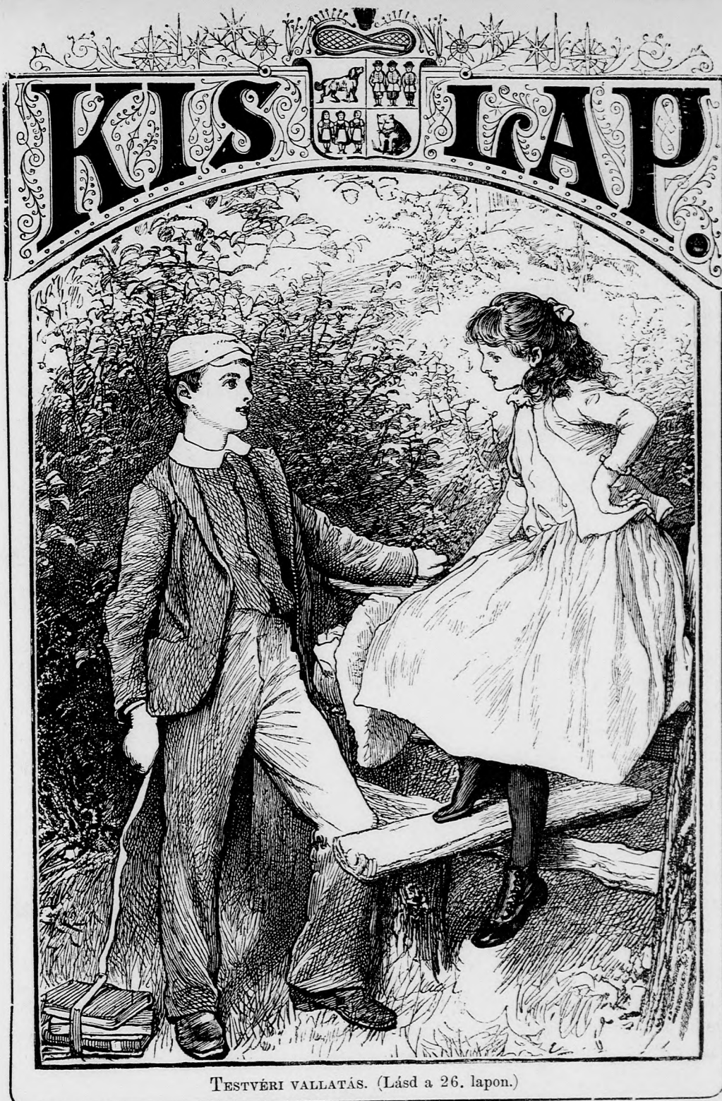
TESTVÉRI VALLATÁS. (Lásd a 26. lapon.)