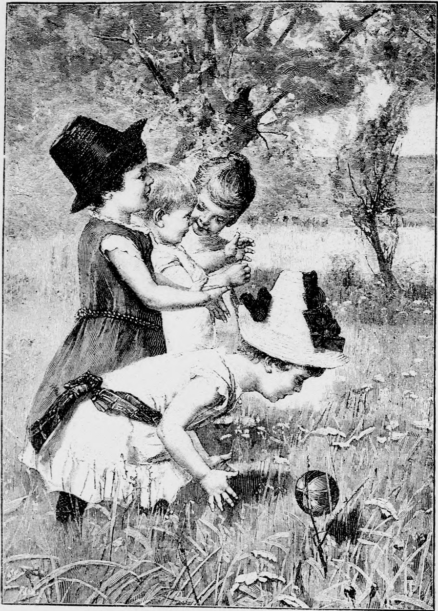
A SZÉP SZABADBAN. (Lásd a 23. lapon.)