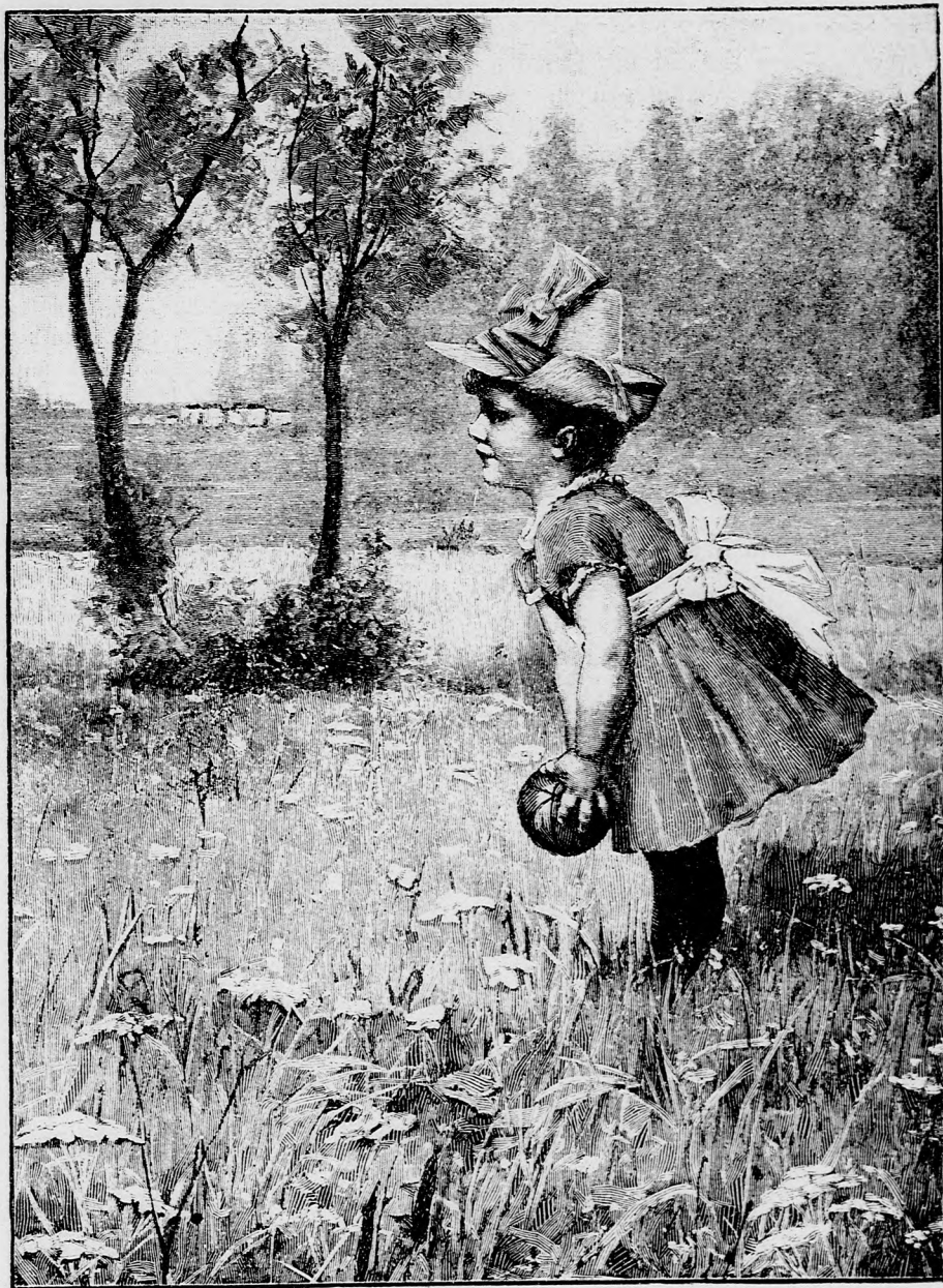
A SZÉP SZABADBAN. (Lásd a 23. lapon.)