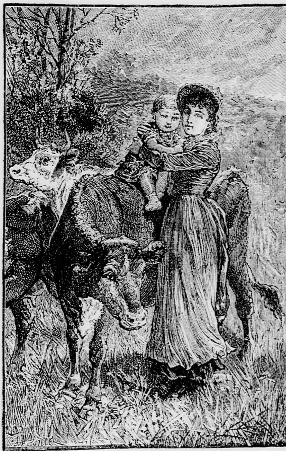
HA LÓ NINCS — BORJU IS JÓ. (Lásd a 107. lapon.)

ellenséges lá- bon élt; a mé- szárosinas pe- dig markos ficzkó volt és vakmerő, hozzá még csufolódo is. Nem csoda tehát, ha Győző azt hajtotta, bárcsak most ne lenne otthon ez a kellemet- len ficzkó, ne lássá ilyen sá- ros állapotban. De biz' a mé- szárosinas ép- pen ott álldo- gált a bolt előtt s egy mér- ges képű kutya feküdt mellette. S amint az öt kiránduló elha- ladt, a vásott mészárosinas nagyot kacza- gott és csufol-