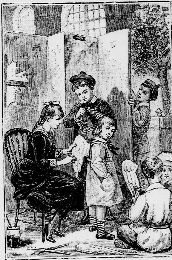
ÖLTÖZKÖDŐ ANGYAL. (Lásd a 106. lapon.)

— Elcsente a mi jó falatunkat! kiáltá Búboska nagy haraggal. Ez már csunyaság!