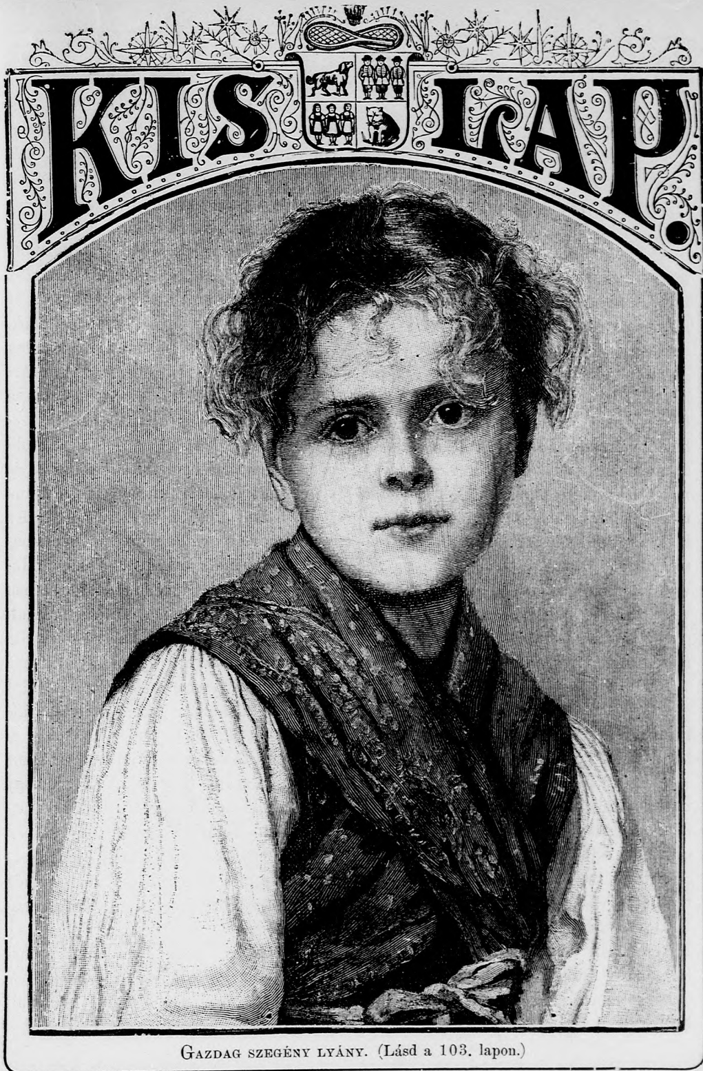
GAZDAG SZEGÉNY LYÁNY. (Lásd a 103. lapon.)