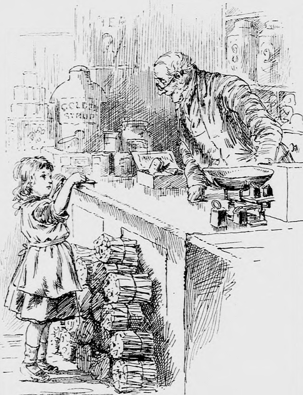
A HÜTELEN VÁSÁRLÓ. (Lásd a 218. lapon.)

mert jól ismerte a durva, de becsületes fiut. Andor pedig szörnyen sértettnek látszott, hogy őt ilyesmivel gyanúsíthatják, mikor neki mindig bőven van pénze, mert nemcsak szüleitől kap pénzt, hanem a bácsitól is, a nénitől is. Nincs az