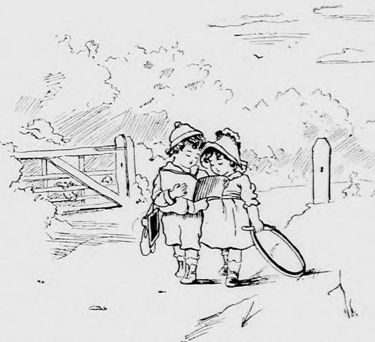
TINIKE ÉS DINIKE. (Lásd a 219. lapon.)

— Persze hogy nem! Azzal kérkednek, hogy ők ott laknak az emberek házánál, őket nem bántja senki, lenéznek minket, pedig még igazi fészket sem tudnak rakni és nem bírnak itt a fán megélni, mint más jóra való