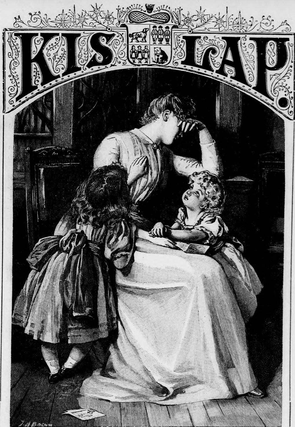
AGGÓDÁS. (Lásd a 283. lapon.)