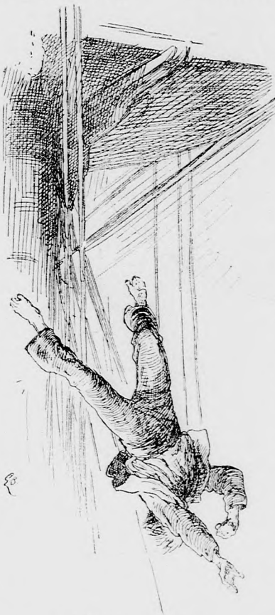
... FEJJEL LEFELÉ.