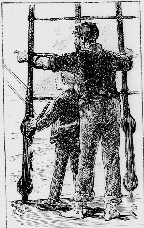
— NÉZZEN... ARRÁ A FEKETE PONTRA. (Lásd a 360. lapon.)

Egyik társunknak azonban kevés öröme telt benne. Pedig neki volt a legnagyobb szüksége rá, hogy kellemes enyhe levegőn üdüljön. Nagyon beteg volt szegény. Az öregebb matrózok egyike volt, izmos természetű ember, ki még pár héttel előbb játszva végezte a legnehezebb munkát is. Mi baja esett, biz én nem tudhatam meg. Azaz hallottam, mikor a hajó orvos valami diák-görög szóval mondta, mi a baja, de nem értettem; hanem azt láttam, hogy az orvos nagyon komoly képet vág, valahányszor róla beszél. A kapitány is kiadta a