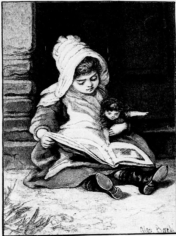
A TÉPETT KÖNYV. (Lásd a 182. lapon.)

sig volt vízben, aztán vállig, majd nyakig és már-már nem birt megállni, sodorta az ár. De éppen, amint halálos rémületében már majd elmerült, utjába akadt