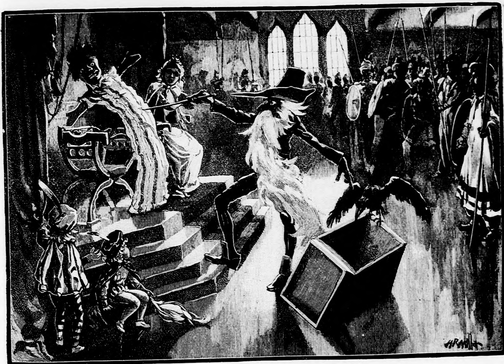
— VISSZA A LÁDÁBA. (Lásd a 270. lapon.)

Akkor nem köll elkergetni, mert hátha valami szép ajándékot hoz. De csak hadd várjon, mert most nem érek rá, hogy vele töltssem az időt.