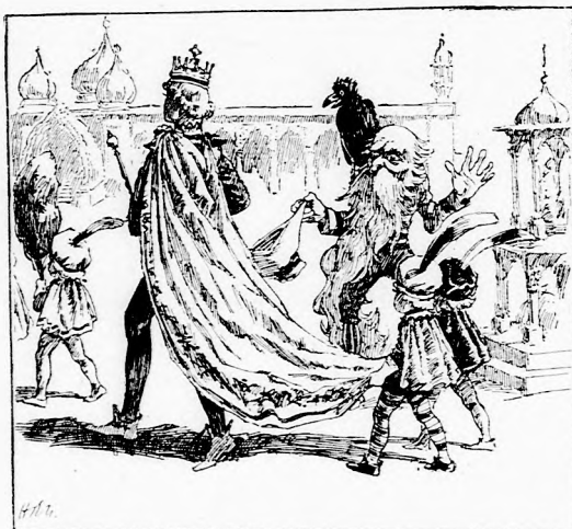
... ALÁZATOSAN LEVETTE SÜVEGÉT.

— Menjünk haza, holló szolgám. Persze, nem jól gondoltam ki, hogy mit kérjek a hatalmas királyfítól. Nem illik