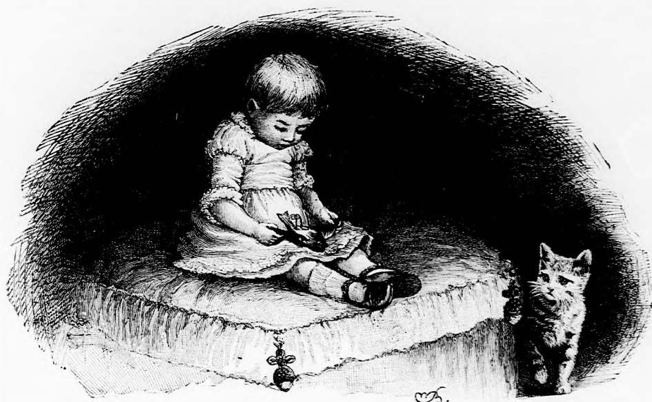
KÉT BŰNÖS. (Lásd a 262. lapon.)

Thezeus alig tudta megvárni, hogy Egeus király őt felismerje, annyira vágyott már az ölelésre. A trónhoz közelvedve, néhány szót akart mondani üdvözlötül, melyeket idejövet kigondolt; de a sok kimondhatatlan gyöngéd érzelem, mellyel szive el volt telve, elfojtotta