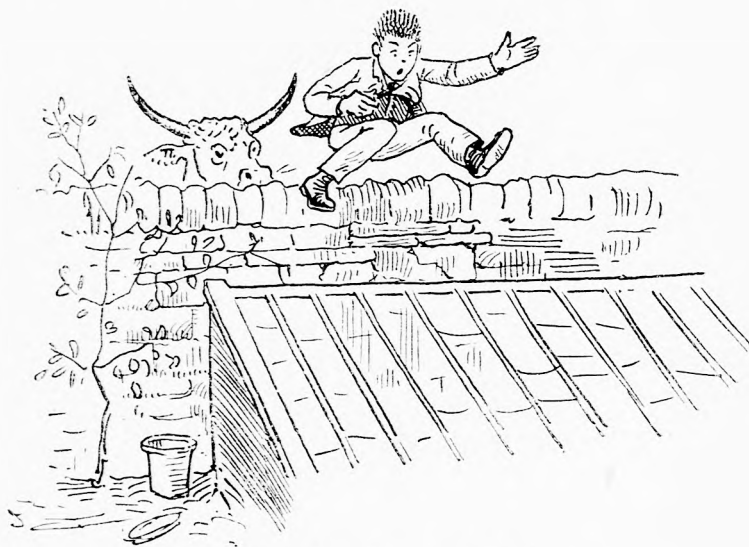
MENTŐ UGRÁS. (Lásd a 287. lapon.)

szóval, és mikor jobban oda figyelt, keserves zokogást, mely sohajokat hallott, melyek a palotából, az utcázáról, a templomokból és a város minden egyes házából szálltak fel hozzá. A fájdalomnak ez a sokféle kifejezése, mely ezrek szivéből fakadt fel külön-külön, abba az egy szivrepszítő hangba gyült egybe, mely Thezeust felköltötte álmából. Gyorsan magára vevé ruháit — nem feledve el