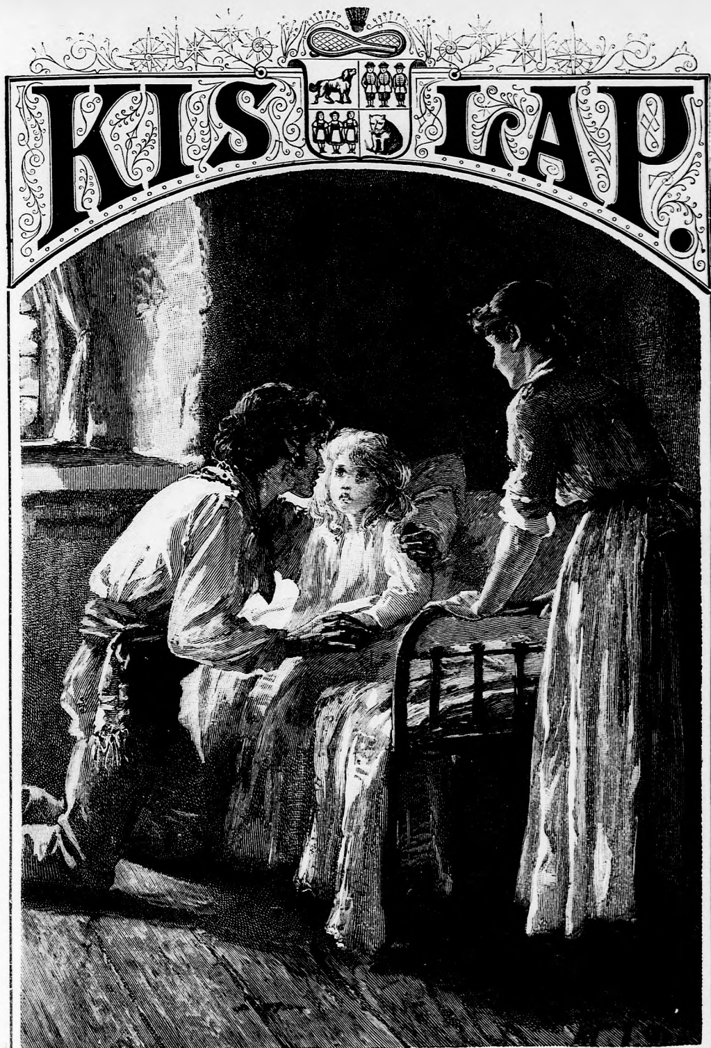
A TENGERÉSZ BUCSUJA. (Lásd. a 284 lapon.)