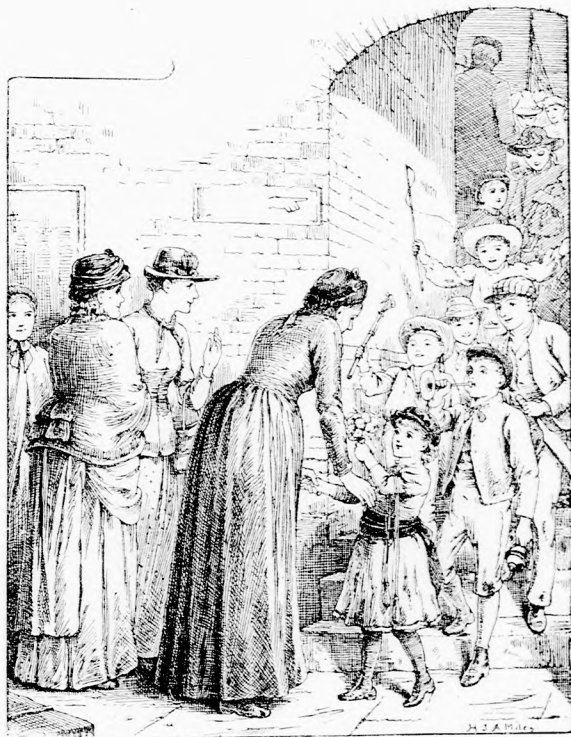
... NAGYVIGSÁGGAL VONULTAK BE.

— Oh! Hogy lépünk a tanár elé? Mit mondjunk? Minek is fogtunk bele? Én haza szököm!