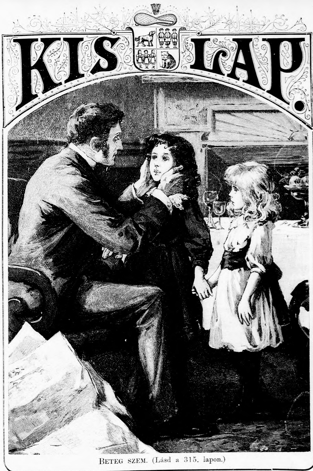
BETEG SZEM. (Lásd a 315. lapon.)