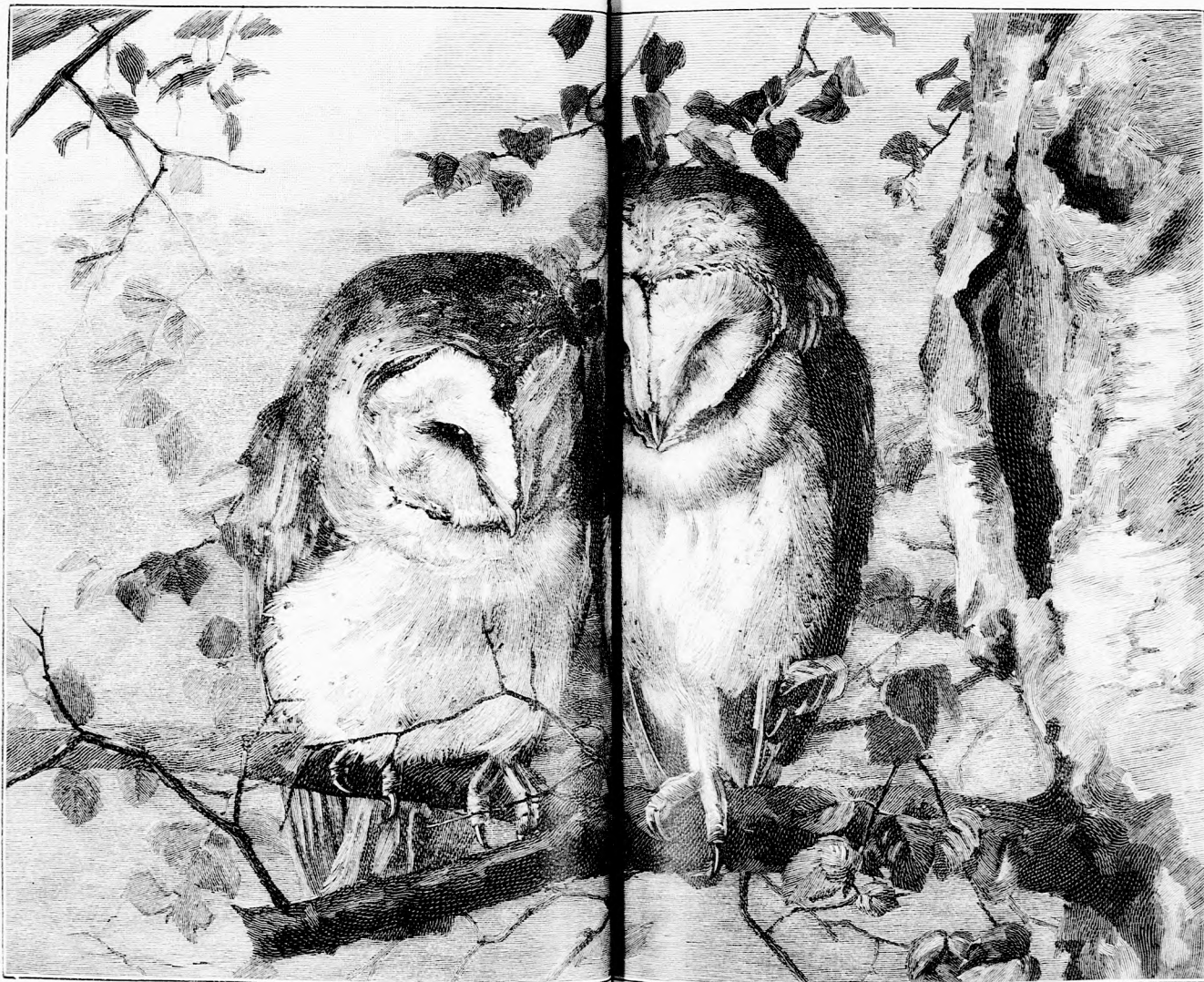
SZENDERGÉS ÓRÁK (Lásd a 308. lapon.)

— Oldozzatok fel, eresszetek el, ti rablók, haramiák!