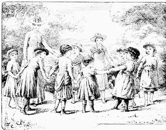
... A LEÁNYOK JÁTSZOTTAK. (Lásd a 318. lapon.)

nézeget szét az a Jenő! Azt hiszi, hogy ő különb zászlótartó, mint mi voltunk.