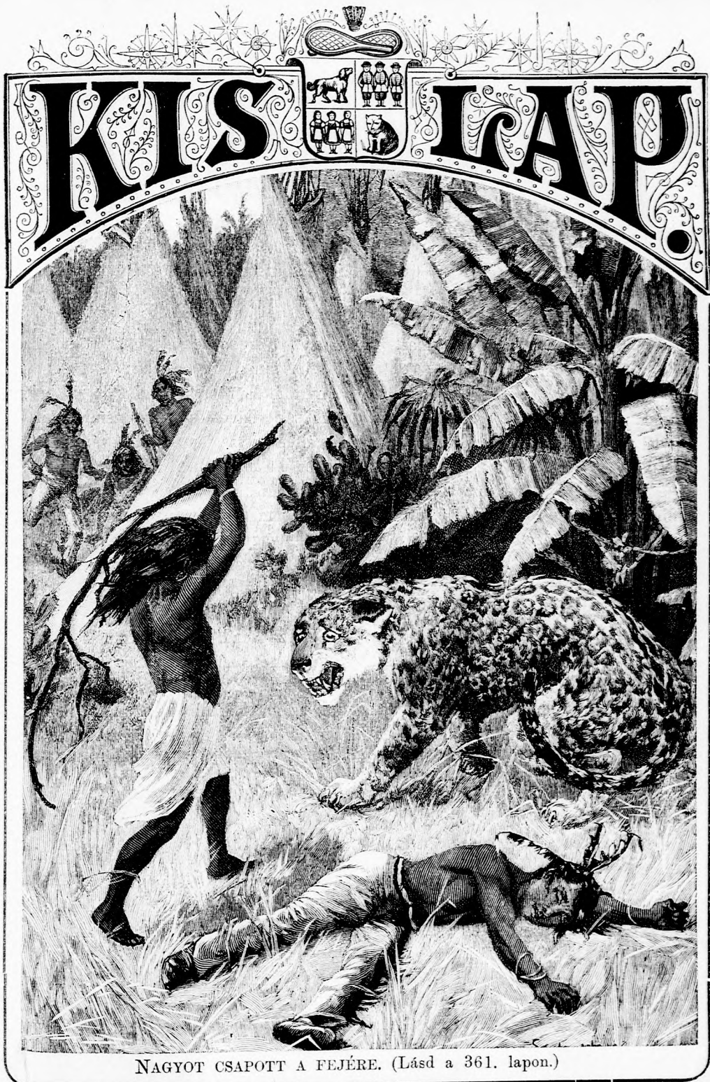
NAGYOT CSAPOTT A FEJÉRE. (Lásd a 361. lapon.)