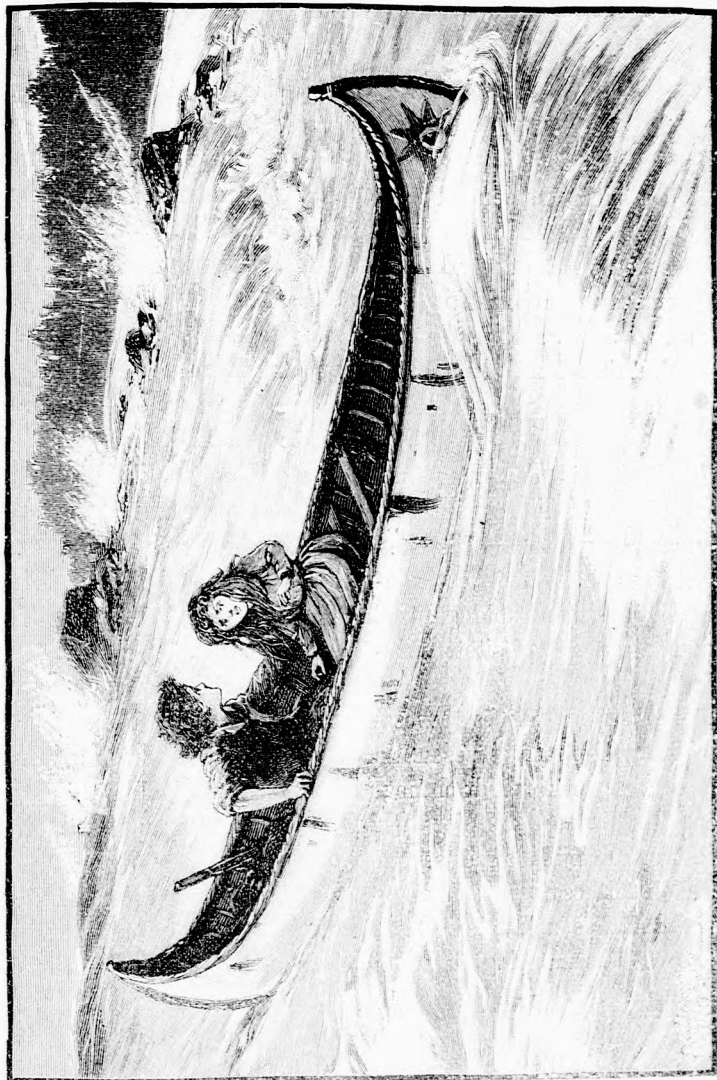
... GYORSAN SUHANTAK LE. (Lásd a 367. lapon.)

kedvök van rá, hadd jöjjenek. Valami nagyon gyorsan úgy sem fogunk előre jutni, velünk tarthatnak.