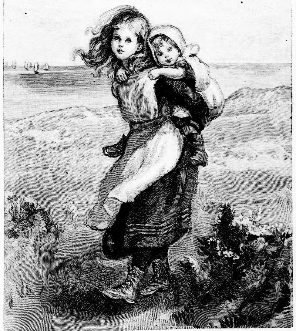
AZ ÉN BÁRÁNYKÁM. (Lásd a 375. lapon.)

XL. kötet, 24. szám. Ára negyedévre 1 frt 40 kr. Egyes szám ára 12 kr. 1891. június 14-én. Megjelen hetenkint egyszer oldalon.