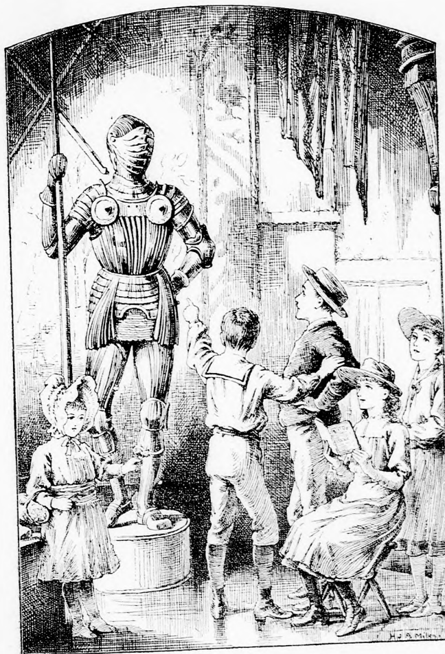
AZ ÖSÖK. (Lásd a 399. lapon.)

godtan. A fehér leánykát vissza adom, mihelyt megmutatta az ezüst barlang nyílását. De te itt maradsz, hogy ellenünk ne vezethesd a fehéréket.