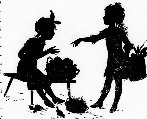
ZÖLDSÉG-VÁSÁRON. (Lásd a 413. lapon.)