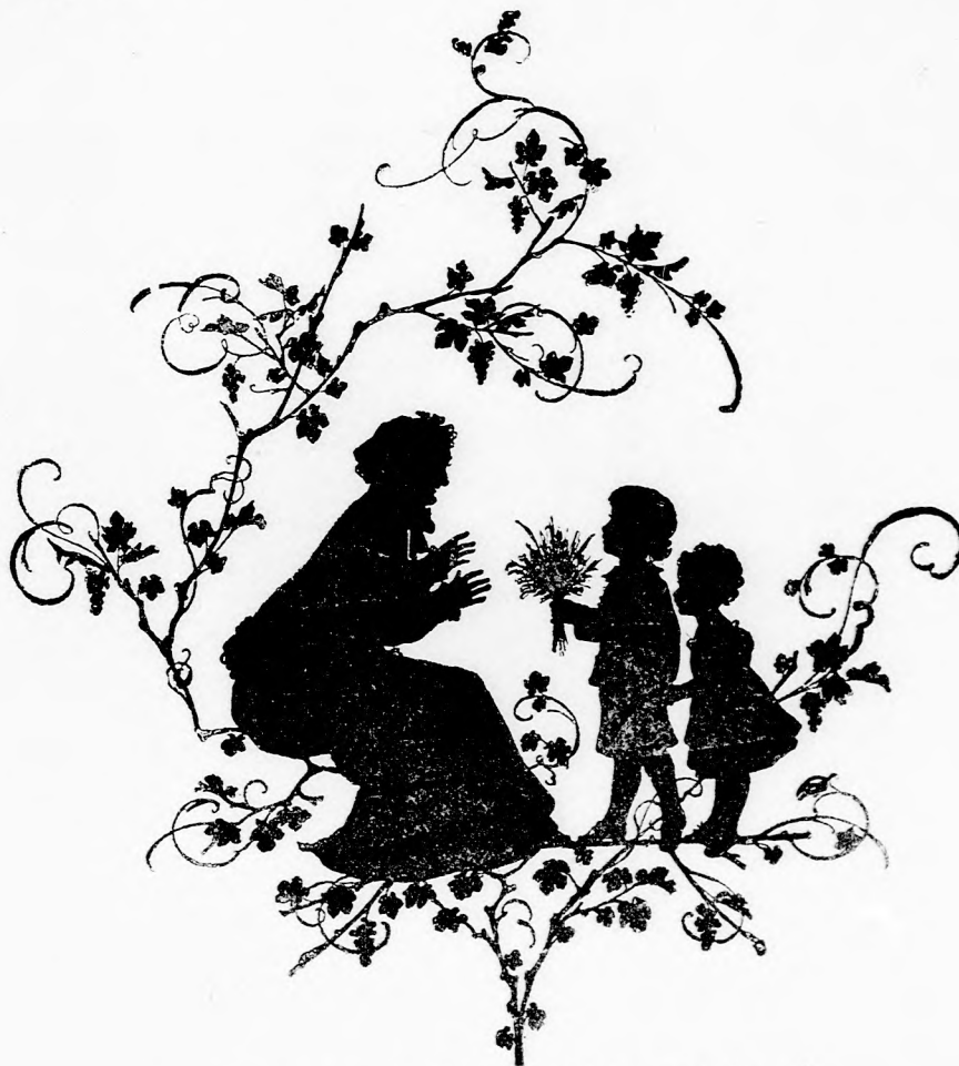
NAGYMAMA SZÜLETÉSNAPIJA. (Lásd a 407. lapon.)

— Ennek a barlangnak nem igen messze másik nyílása is van, szólt Karthy ur. Ebben nem is tévedett. Az a barlang tulajdonképen hosszú alagut volt. A fák-