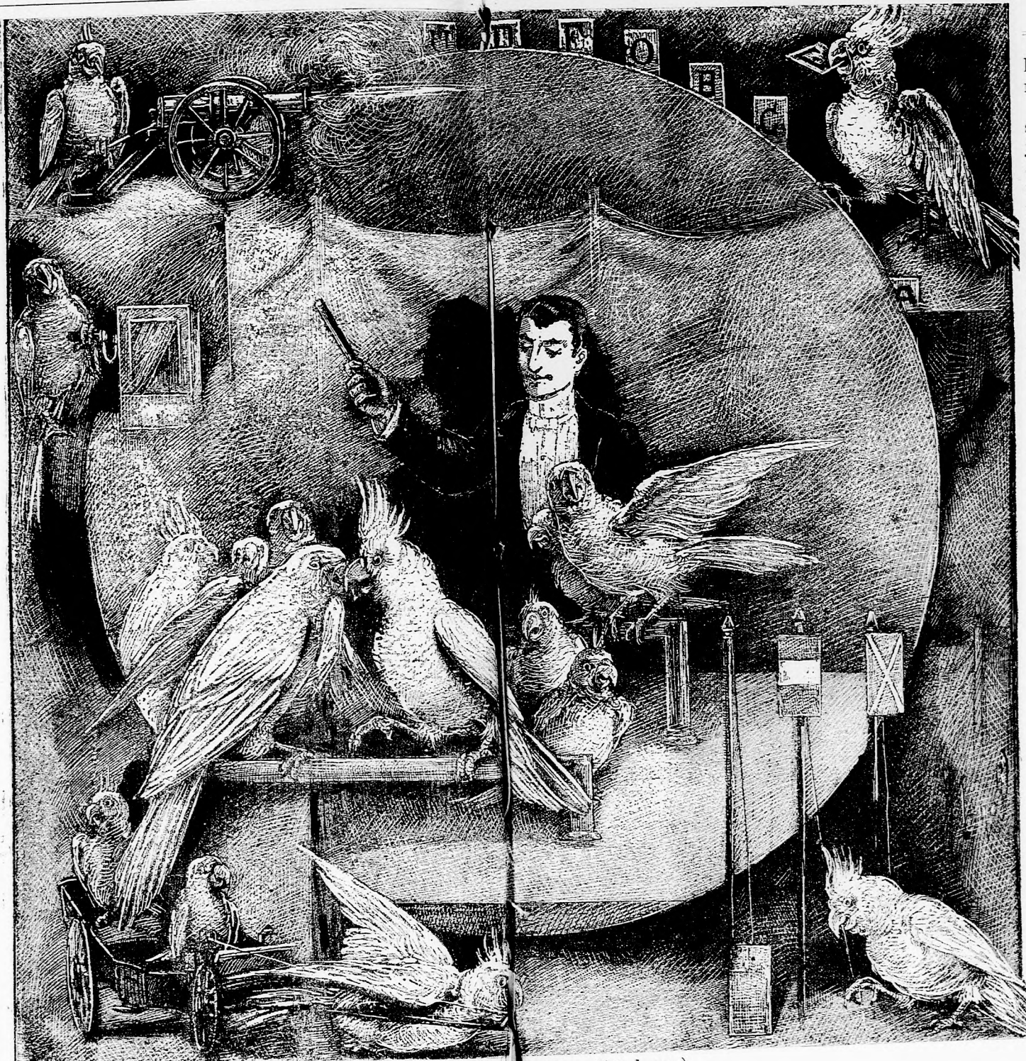
TUDÓS PAPAGÁJOK (Lásd a 412. lapon.)

Alig fogott azonban hozzá az énekléshez: rigó, veréb s mind a többi madár, aki csak ott volt, elmenekült, ahogy a szárnya birta, mert olyan borzasztó sivalkodást még nem