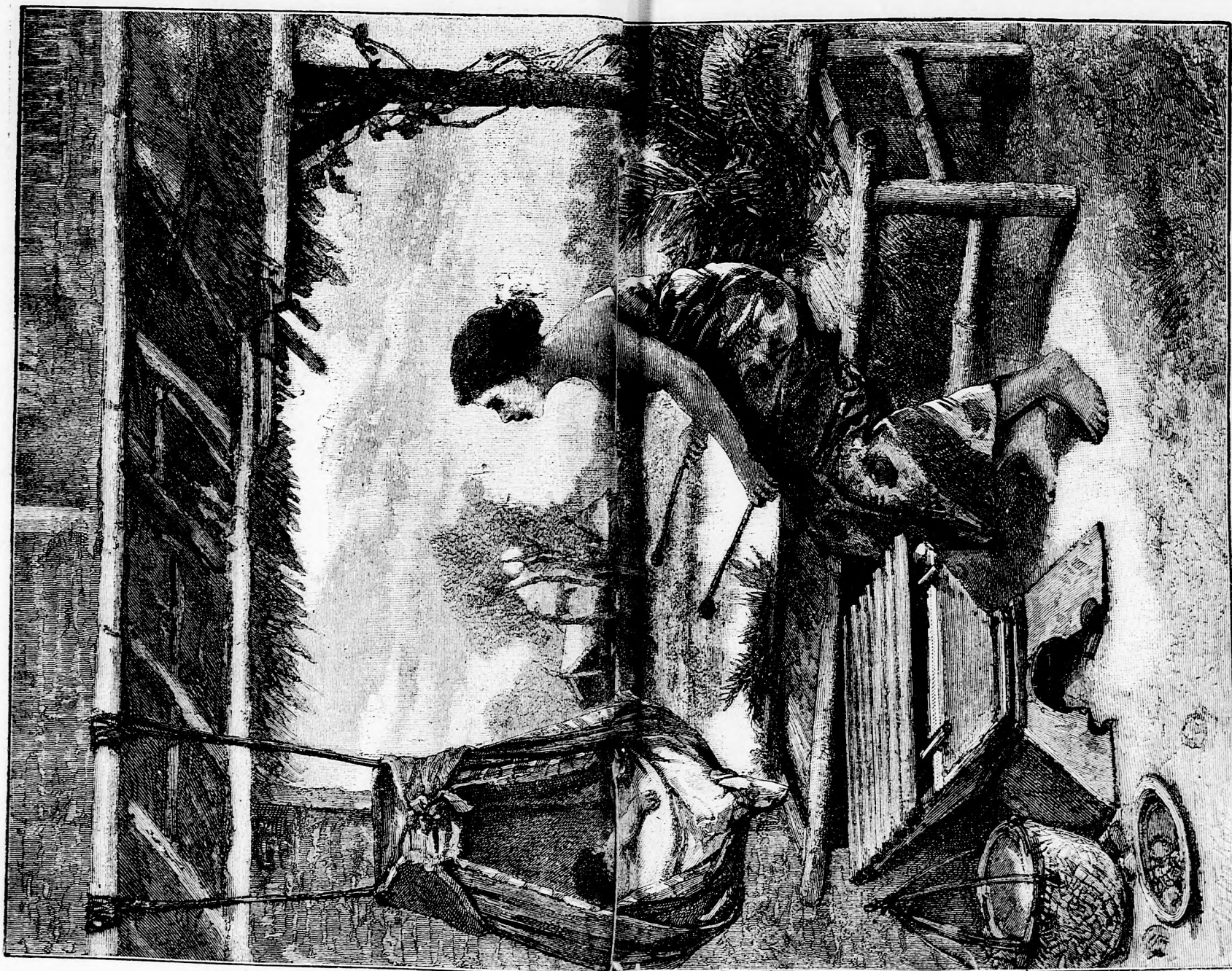
FELLAH-BABA. (Lásd a 31. lapon.)