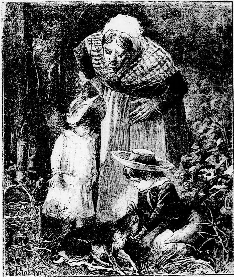
TALÁLT ÖZIKE. (Lásd a 63. lapon.)

— Igen ám, de ma kellett volna elkészülni vele.