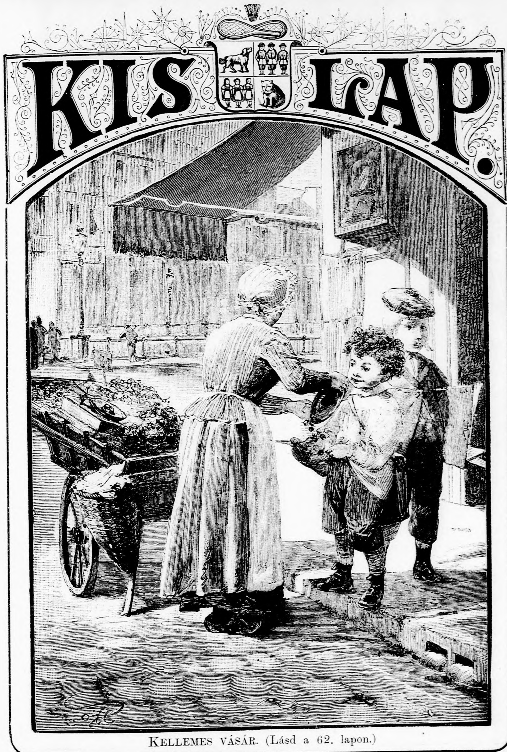
KELLEMES VÁSÁR. (Lásd a 62. lapon.)