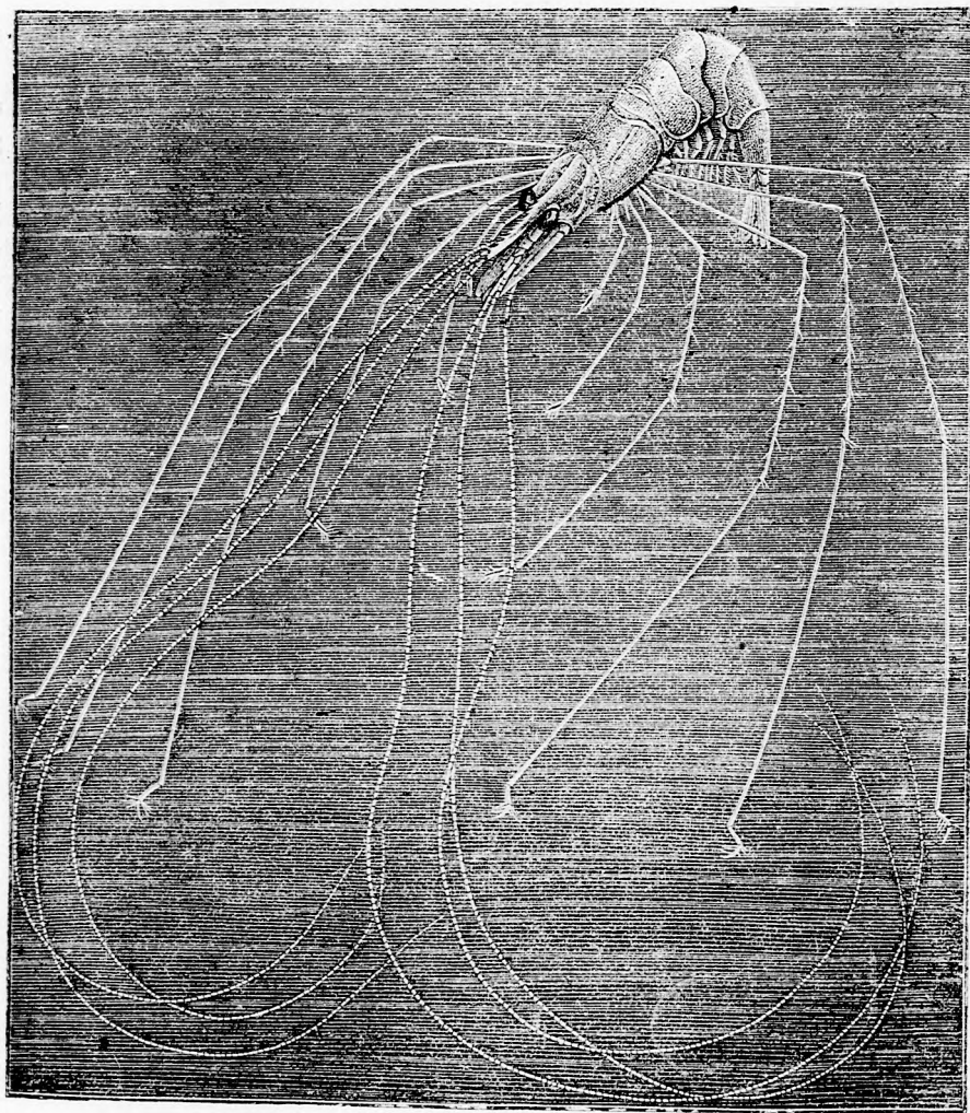
A TENGERFENÉK LAKOSAI. A hosszú bajszu rák.

fölött. Pedig ezekben a mérhetetlen mélységekben is száz meg százféle lény él és egy részöket már ismerjük is.