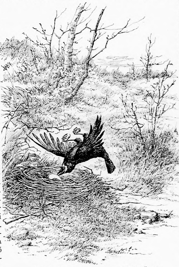
... BUKFENCZET VETETT A LEVEGŐBEN.