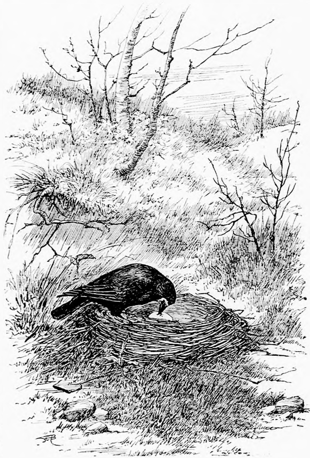
... ÖSSZETÖRTE A TOJÁST.

— Agyon kell lőni azt a gonosz tolvajt! mondám elkeseredve.