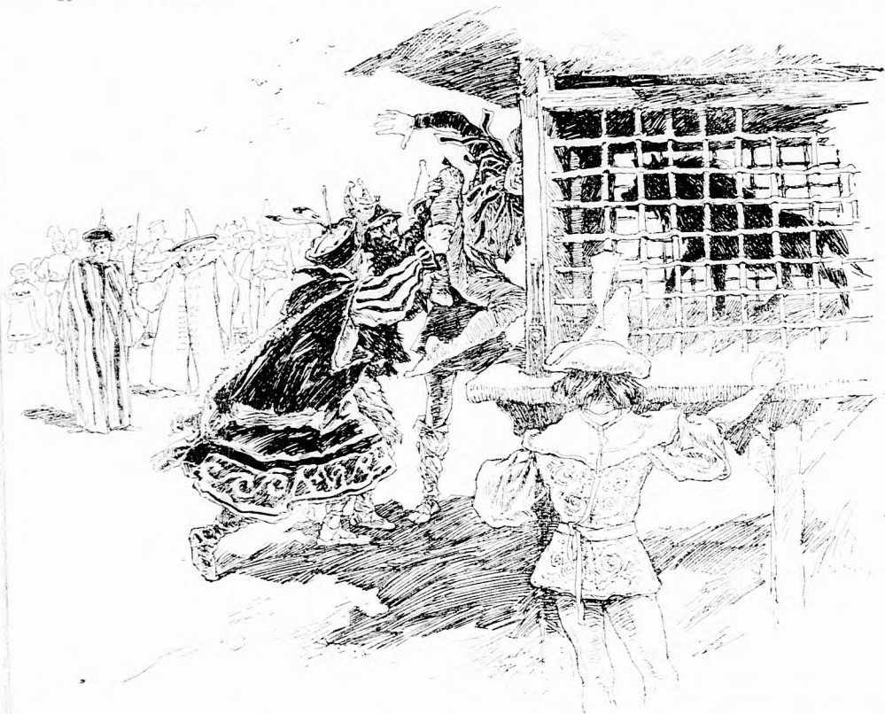
A HIENA VÁRTA. (Lásd a 283. lapon.)

Ujra megindult a várkastély felé. Ott fönt pedig ezalatt a király váltig csodálkozott, hová lett az ő fő-főminisztere és