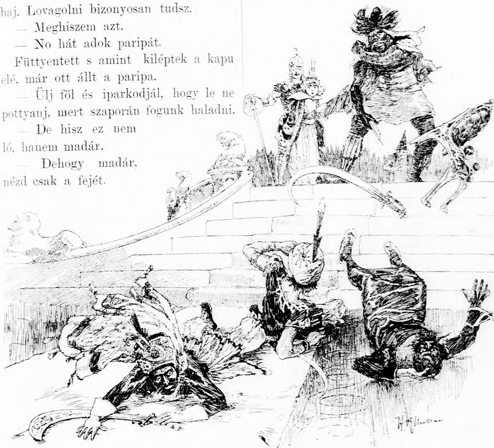
EGYSZERRE RÖPÜLTEK. (Lásd a 143. lapon.)

— Az a derék. Szalad is, röpül is. No, ne töltsük az időt.