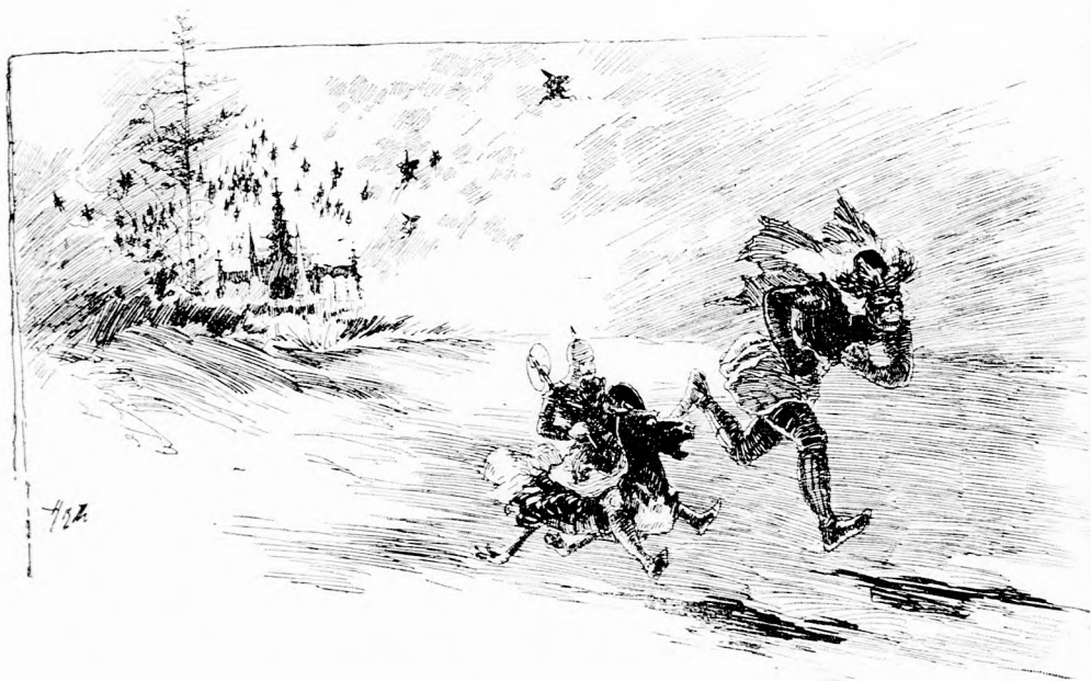
AZ ÓRIÁS GYALOG SZERREL LÉPEGETETT. (Lásd a 141. lapon.)

Biz' Omárnak soha sem volt ilyen aggodalma, most pedig legkevésbé gondolt falatozásra, mikor már szeretett volna haza repülni; de az óriás csöppet sem sietett, hanem átsétált a szomszédos ebédlőbe, ahol terítve várta az asztal.