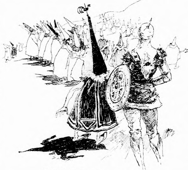
... ELEFÁNTOT LÁTTAK LEBEGNI.