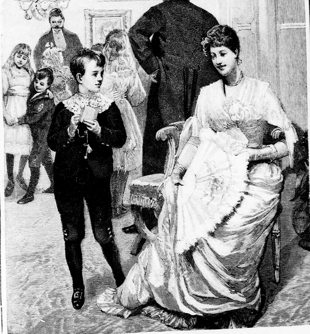
JÓL VAN, ELEMÉRKÉM, UGY LESZ. (Lásd a 135. lapon.)