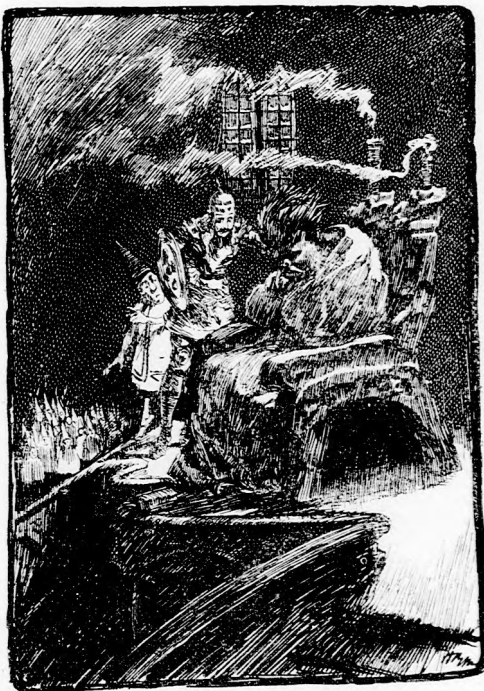
...SZUNDIKÁLT. (Lásd a 138. lapon.)