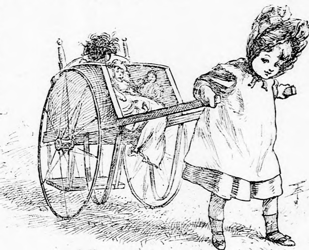
MEGKOCSIKÁZTATTA ÖKET. (Lásd a 222. lapon.)

A baba Vicza nem ellenkezett és nem is sirt, mint azt néha egyik-másik eleven baba meg szokta cselekedni. Engedte szé- pen, hogy Anikó felöltöztesse. Ezzel jócs- kán eltelt az idő, de végre mégis csak elkészült vele. Most már mind a három Vicza szépen fel volt öltözve. Termé- szetes, hogy most tenniök is illik va- lamit.