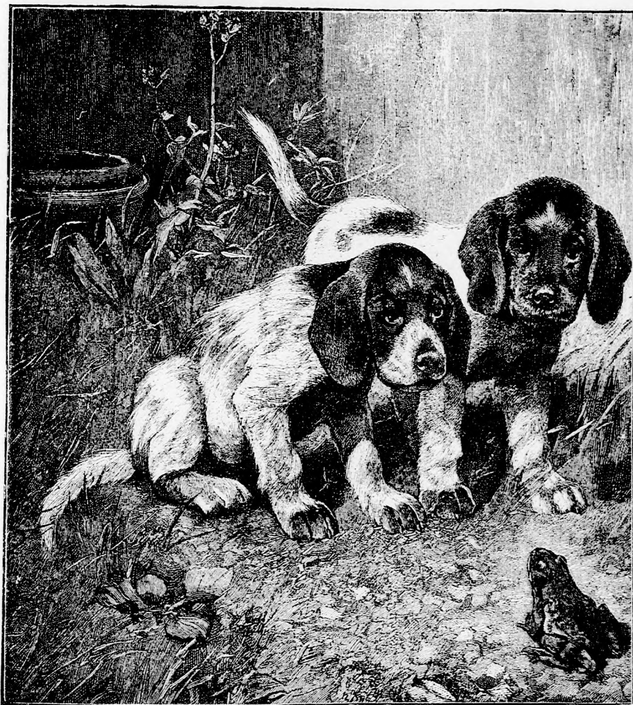
KÜLÖNÖS TALÁLKOZÁS. (Lásd a 224. lapon.)

A vörös-bőrü végre csakugyan meg- elégelte az álldogálást és megindult a