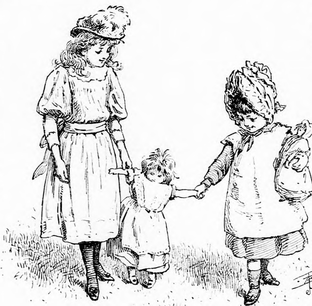
VÉGIG SÉTÁTTAK VELE. (Lásd a 221. lapon.)

— A nagy Vicza talán-talán még a maga lábán is tudna sétálni, csevegett